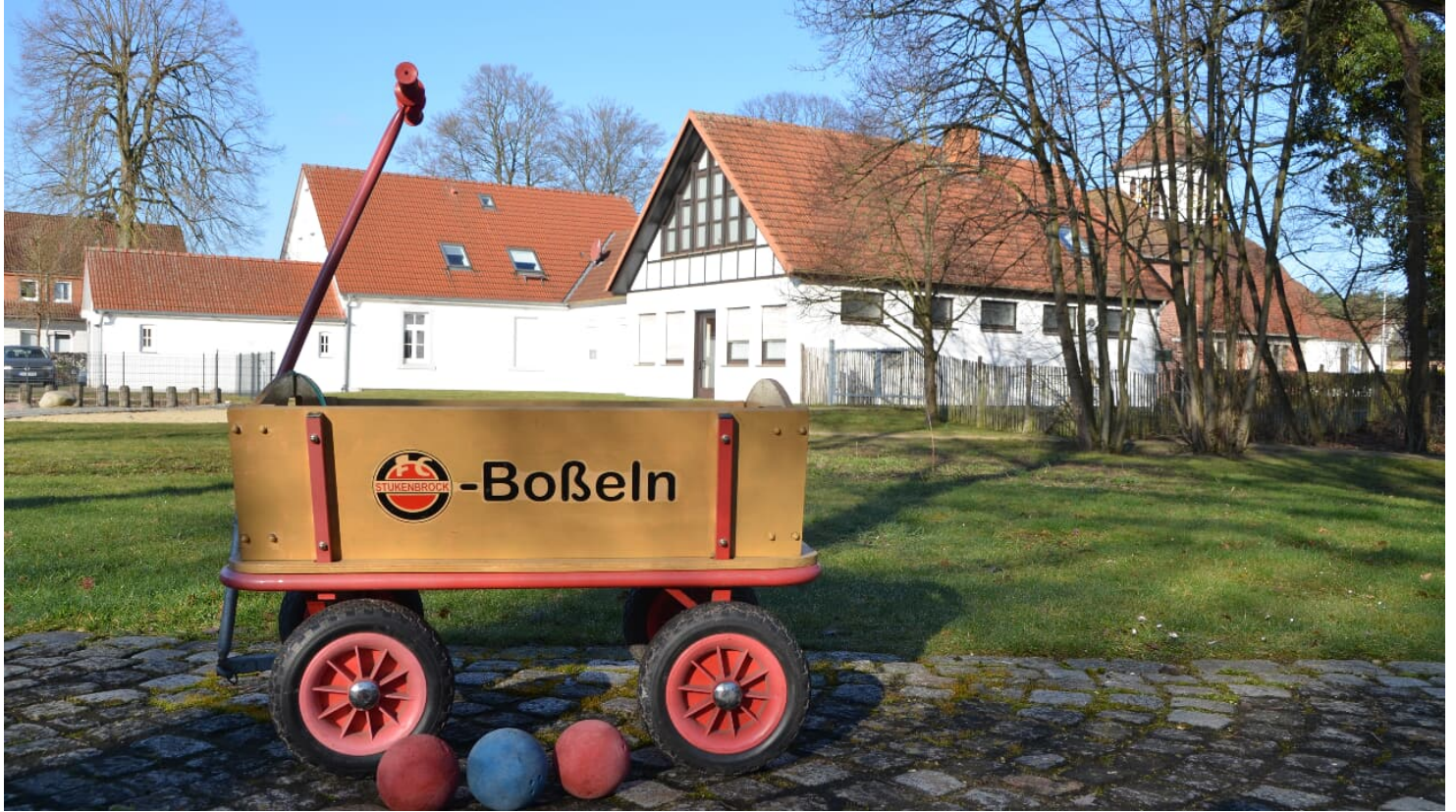
Boßelwagen in Schloß Holte-Stukenbrock