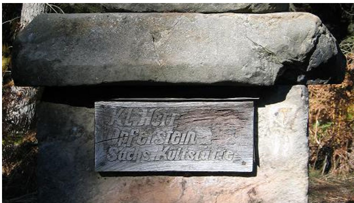
Kleiner Herrgott bei Willebadessen