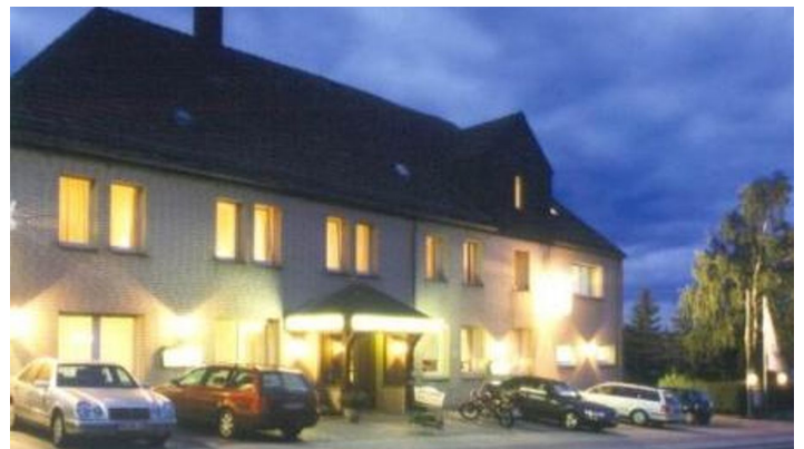
Haus Engemann