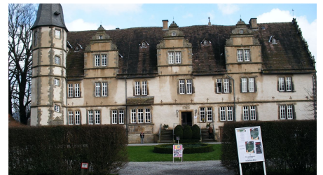
Schloss Wendlinghausen