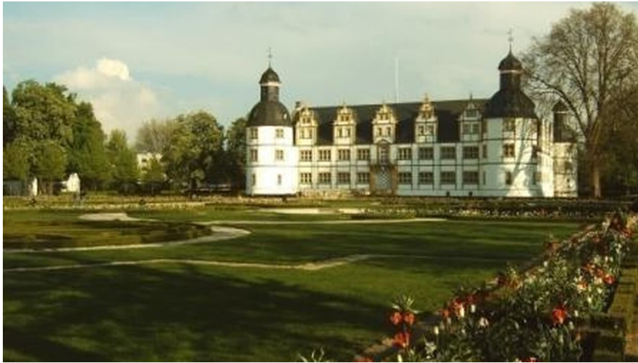
Ganz in der Nähe: Schloss und Barockgarten Neuhaus