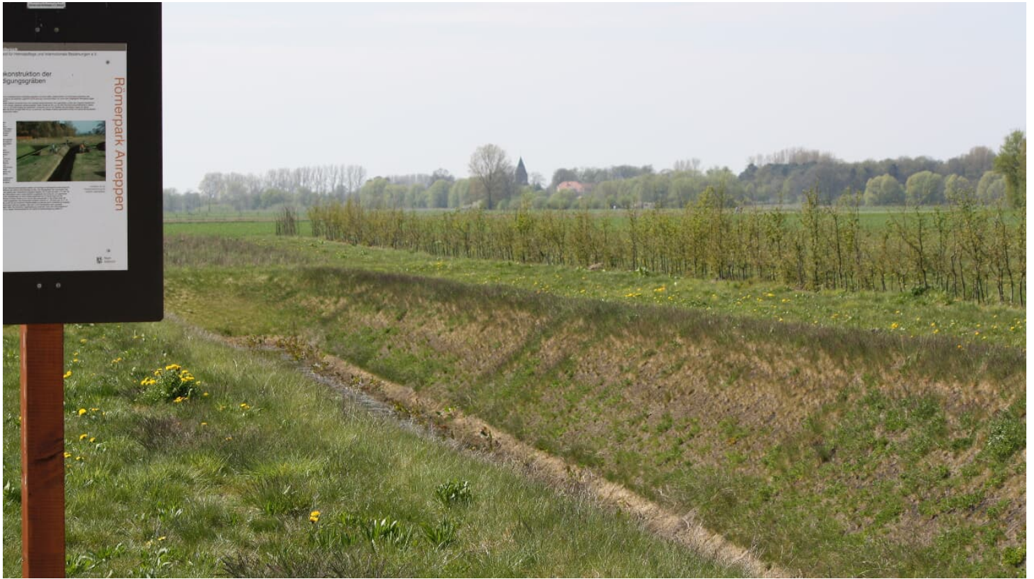
Rekonstruktion des Lagergrabens