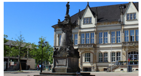
Franz Hausmann Denkmal