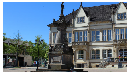
Franz Hausmann Denkmal