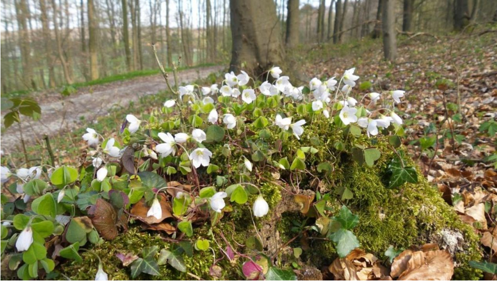
Am Wegesrand