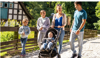
Bielefeld-Tierpark Olderdissen-Teutoburger-Wald-Tourismus-D-Ketz-021.jpg - © Dominik Ketz