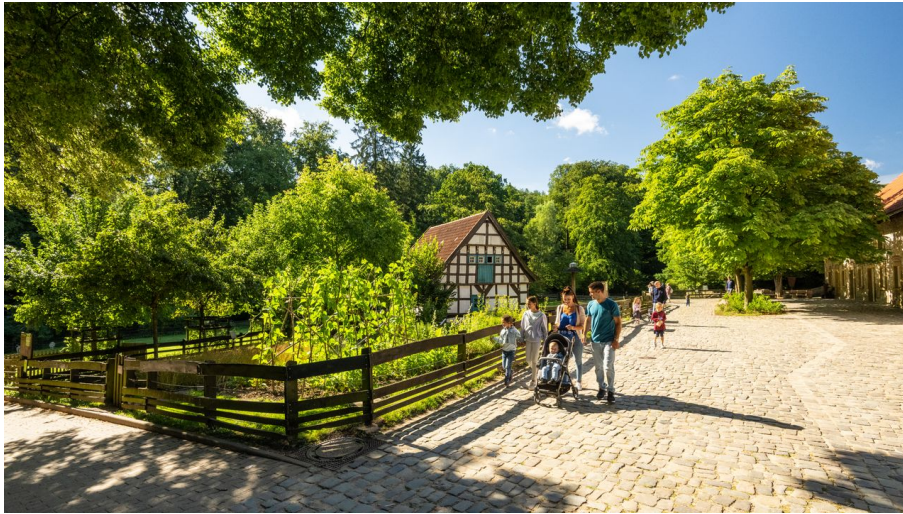
Bielefeld-Tierpark Olderdissen-Teutoburger-Wald-Tourismus-D-Ketz-024.jpg