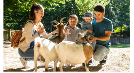
Bielefeld-Tierpark Olderdissen-Teutoburger-Wald-Tourismus-D-Ketz-006.jpg