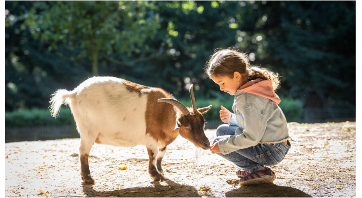
Bielefeld-Tierpark Olderdissen-Teutoburger-Wald-Tourismus-D-Ketz-012.jpg