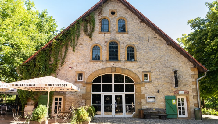
Bielefeld-Tierpark Olderdissen-Teutoburger-Wald-Tourismus-D-Ketz-004.jpg