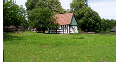
Ravensberger Landschaft