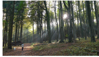
Spaziergang im Wiehengebirge