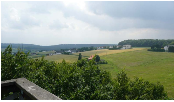
Aussicht vom Wiehenturm