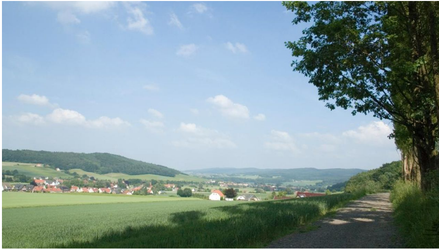
Eggetal in Börninghausen