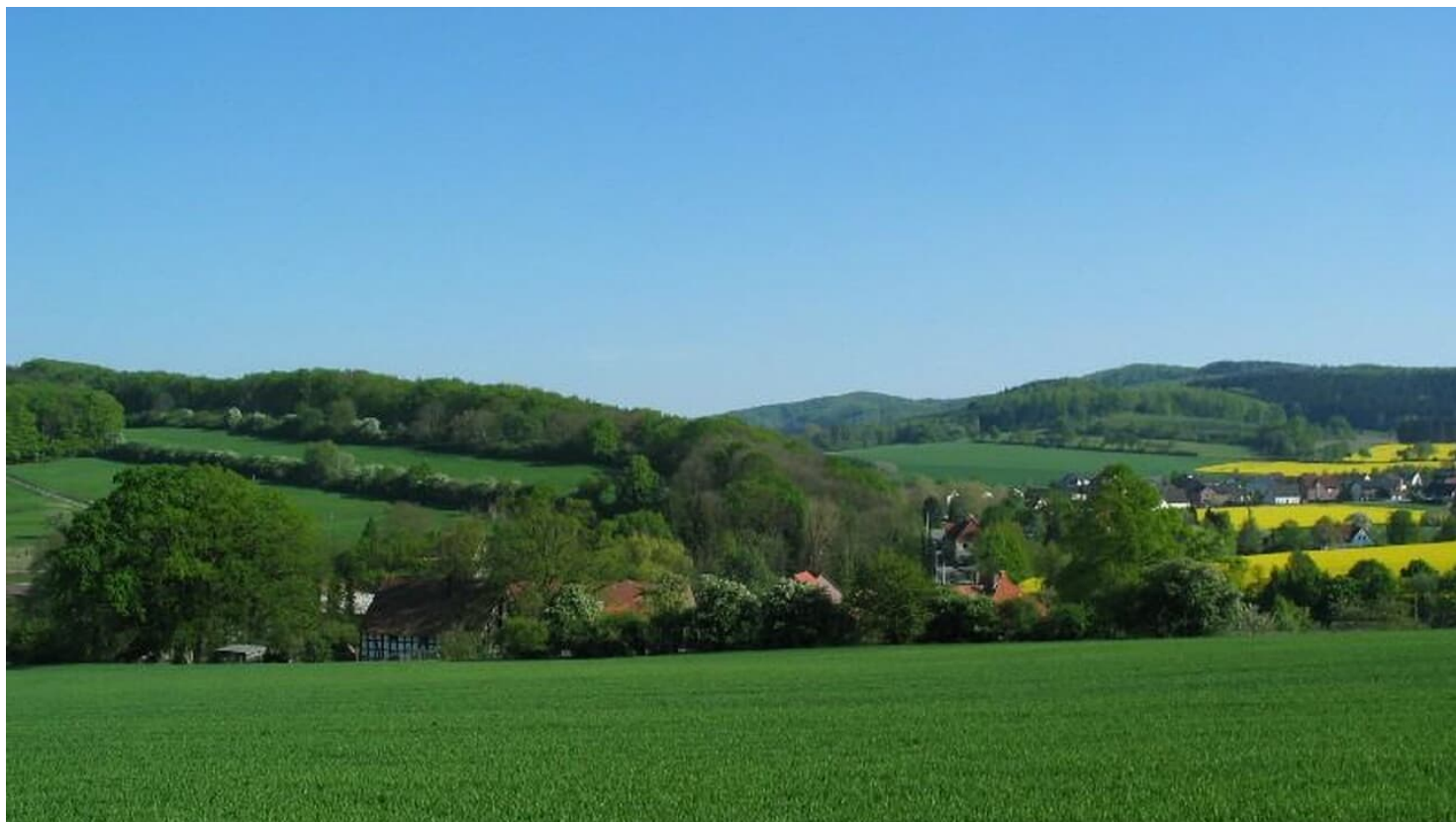
Währentrup Iberg und Huneckenkammer