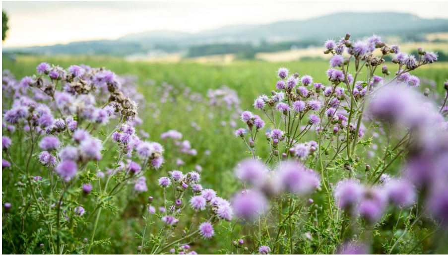
Lage-Hoerster Egge-Teutoburger-Wald-Tourismus-D-Ketz-011.jpg