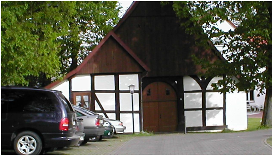
Fachwerkhaus Weberhof