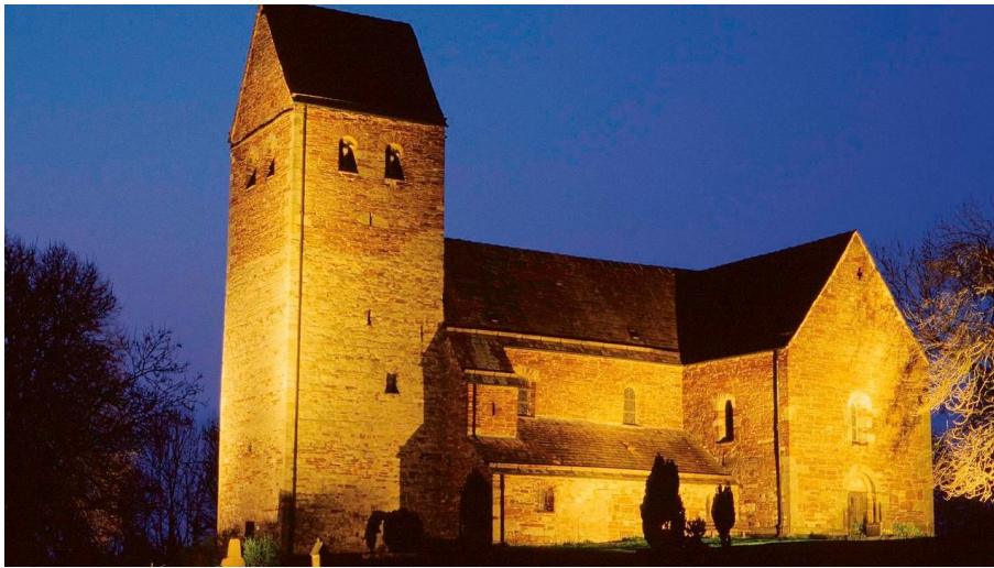
St. Kilianskirche bei Nacht