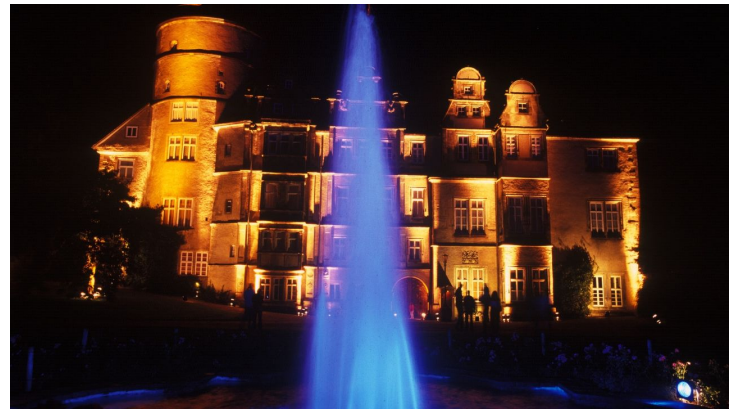
Residenzschloß Nacht