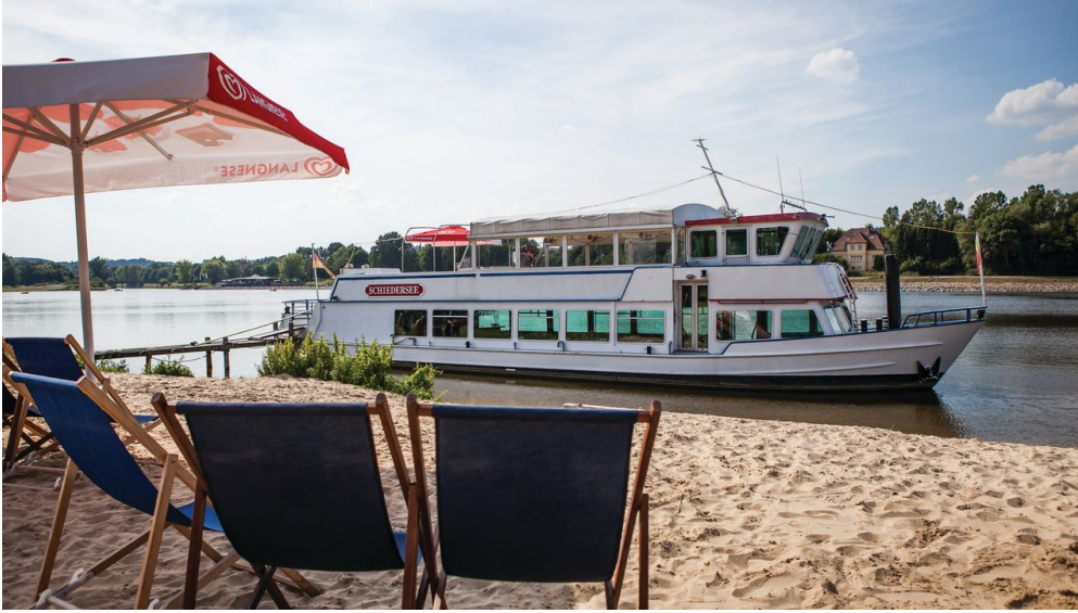
Schiff Schiedersee.jpg