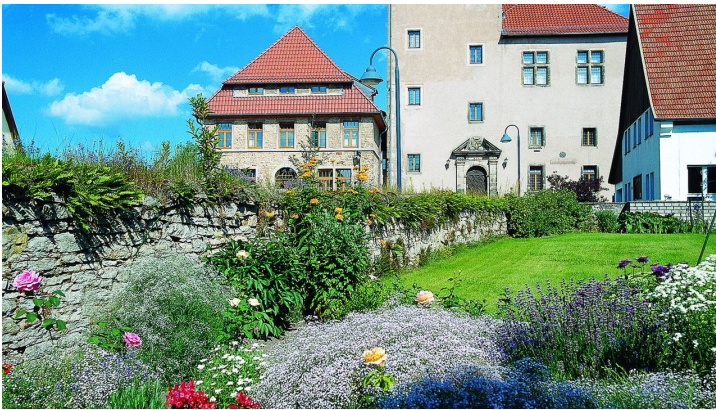
Burg Horn