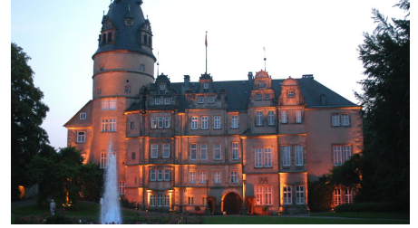
Residenzschloß Dämmerung