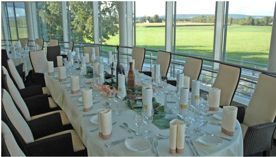
Restaurant Rotondo