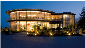
Rila erleben in Stemwede-Lavern