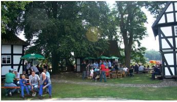
Kolthoffsche Hofmahlmühle Lavern Mahl- und Backtag