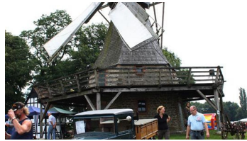
Kolthoffsche Hofmahlmühle Lavern Oldtimertreffen