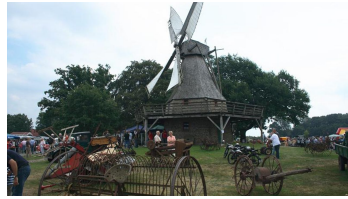
Altmaschinenausstellung auf dem Mühlengelände Lavern