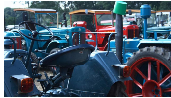
Kolthoffsche Hofmahlmühle Lavern Altmaschinentreffen3