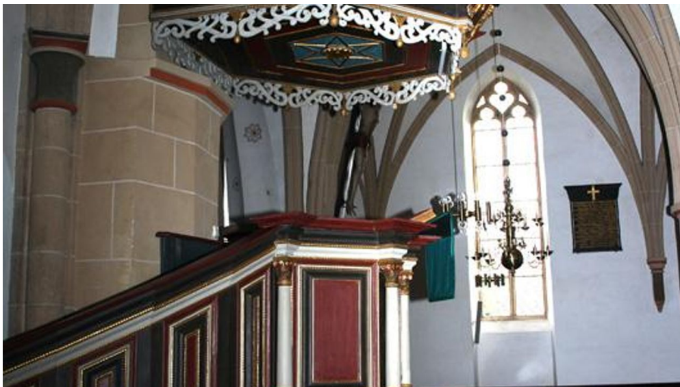
Altar in der Stiftskirche Lavern