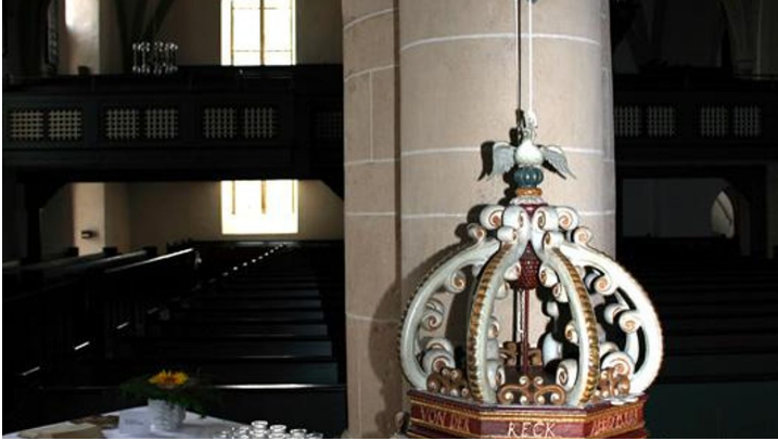
Stiftskirche Lavern Taufständer mit Deckelhochzieher, 1684