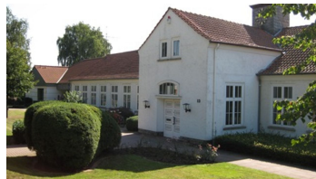
Gemeindeverwaltung Lavern - Touristinfo