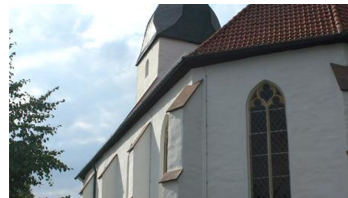
Stiftskirche Lavern Ostseite