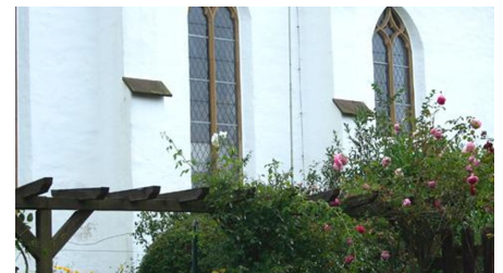
Stiftskirche Lavern mit Rosen