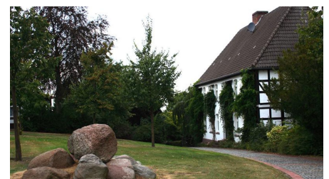
Kirchplatz Historischer Wegweiser