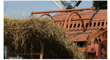
Kolthoffsche Hofmahlmühle Lavern Altmaschinentreffen2