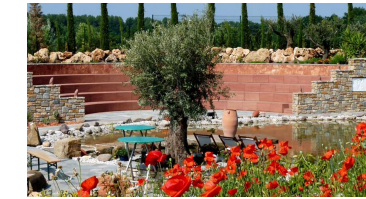
Griechischer Garten