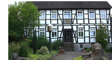
Stiftskurie Löwenburg, 1810