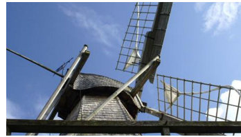
Kolthoffsche Hofmahlmühle Lavern2