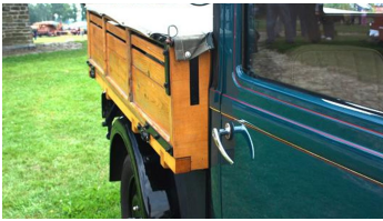
Kolthoffsche Hofmahlmühle Lavern Altmaschinentreffen1