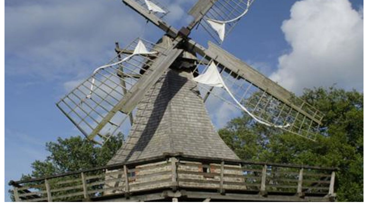
Kolthoffsche Hofmahlmühle Lavern1