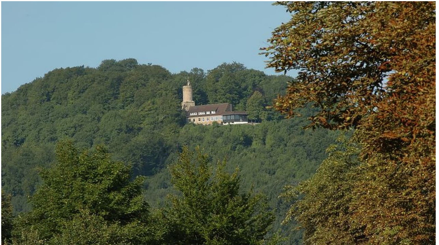
Die Iburg ist ein beliebter Ausflugsort der Region.