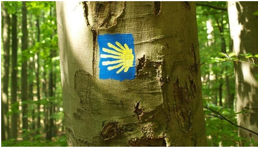
Wegzeichen Jakobsweg