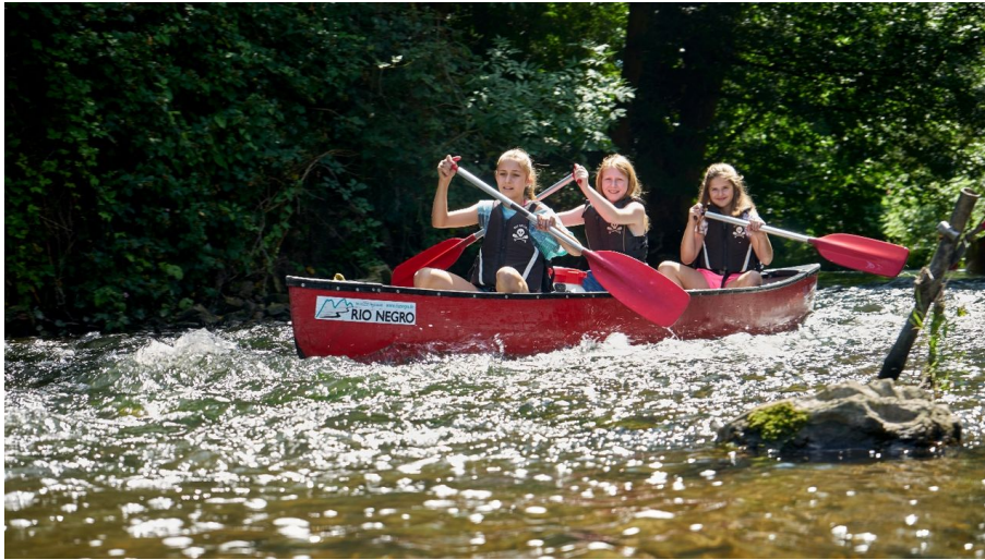
Kanutour Bega und Werre