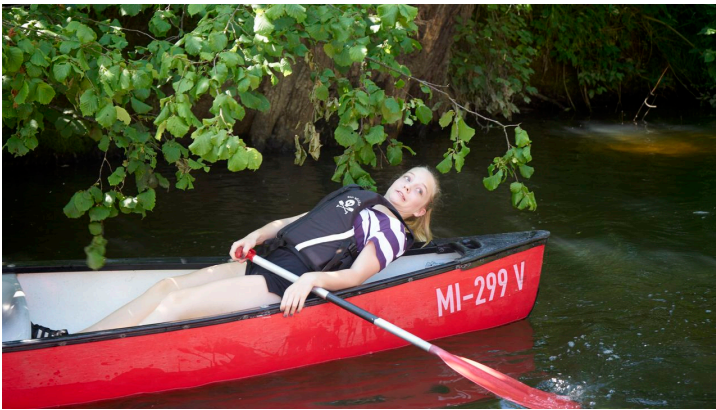
Kanutour Bega und Werre