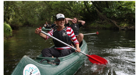
Kanutour Bega und Werre