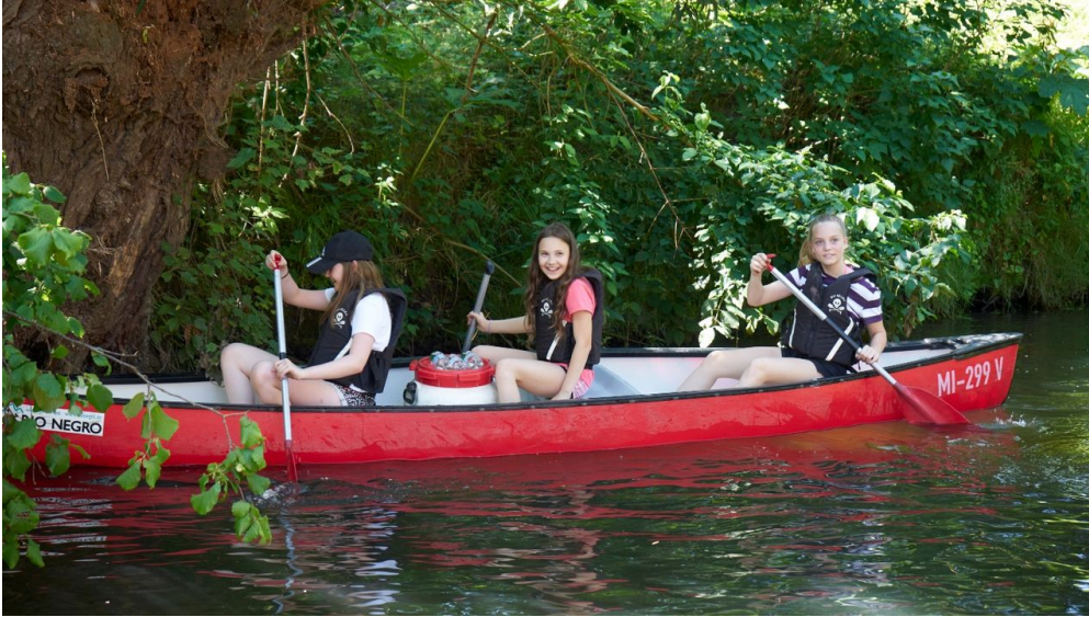
Kanutour Bega und Werre