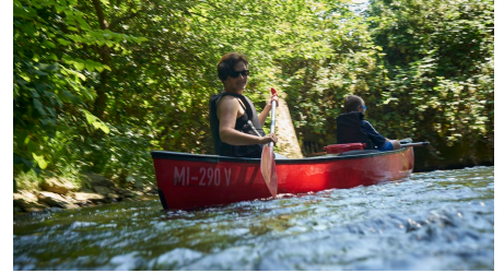
Kanutour Bega und Werre