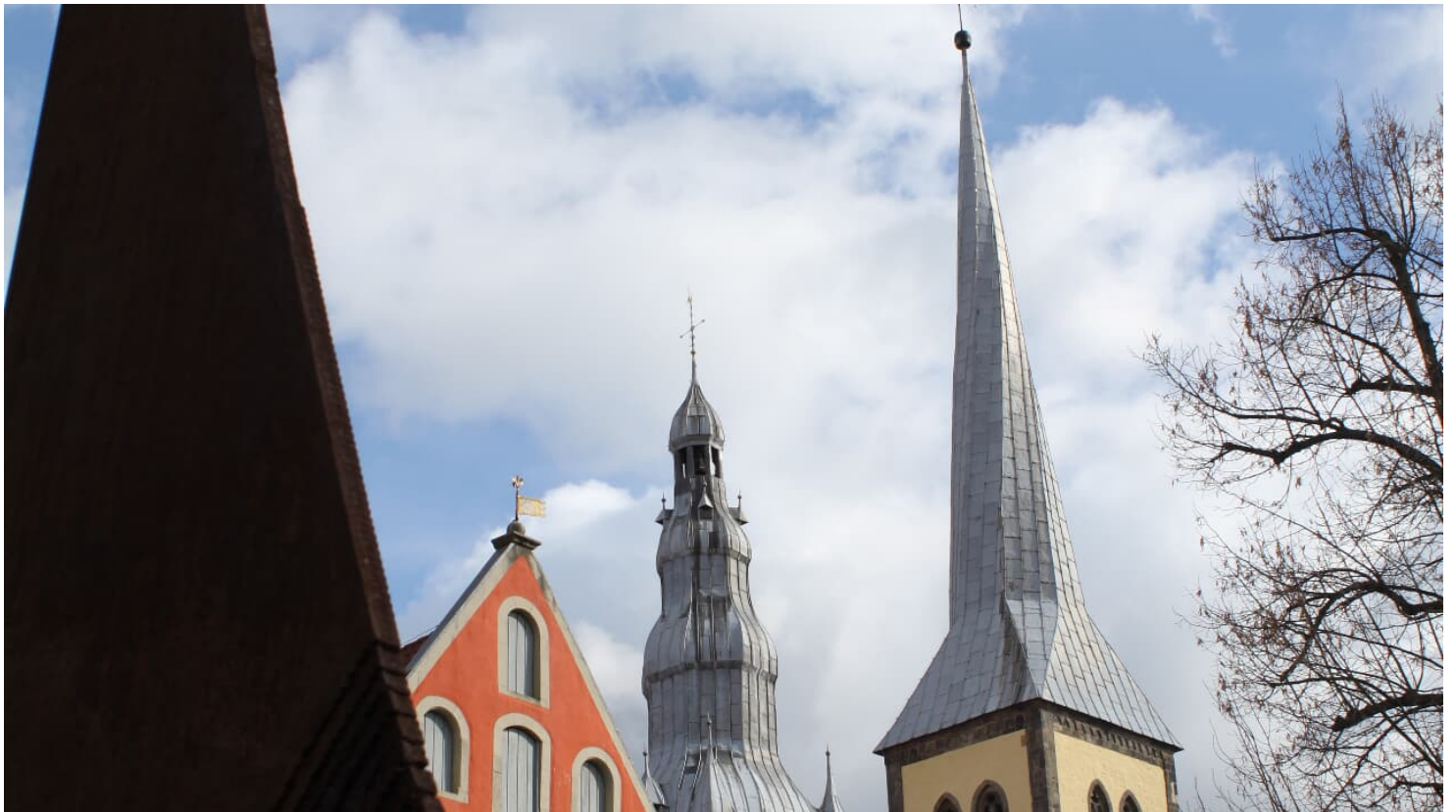
Lemgo Marketing e.V.