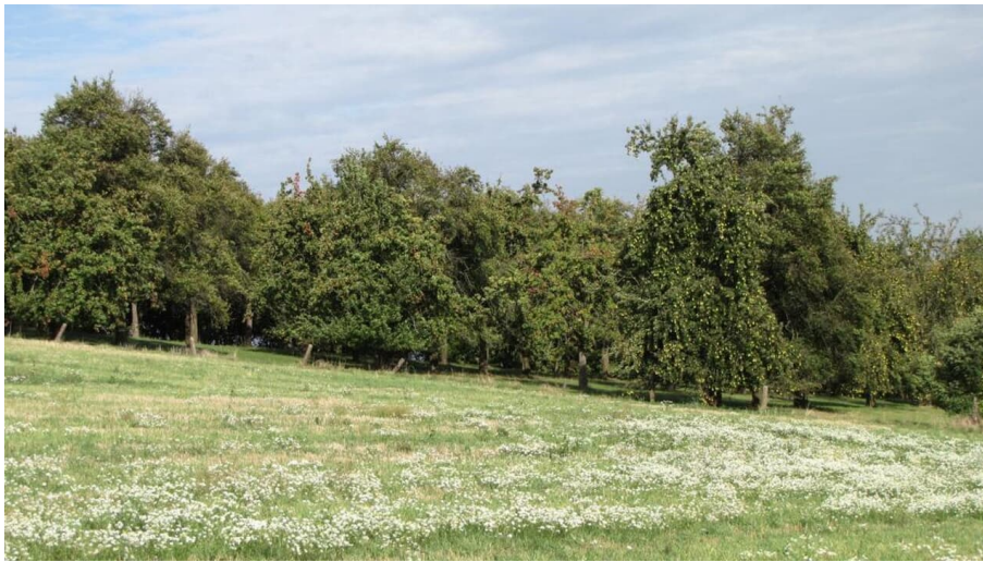
Streuobstwiese am Freudeneck Westrup