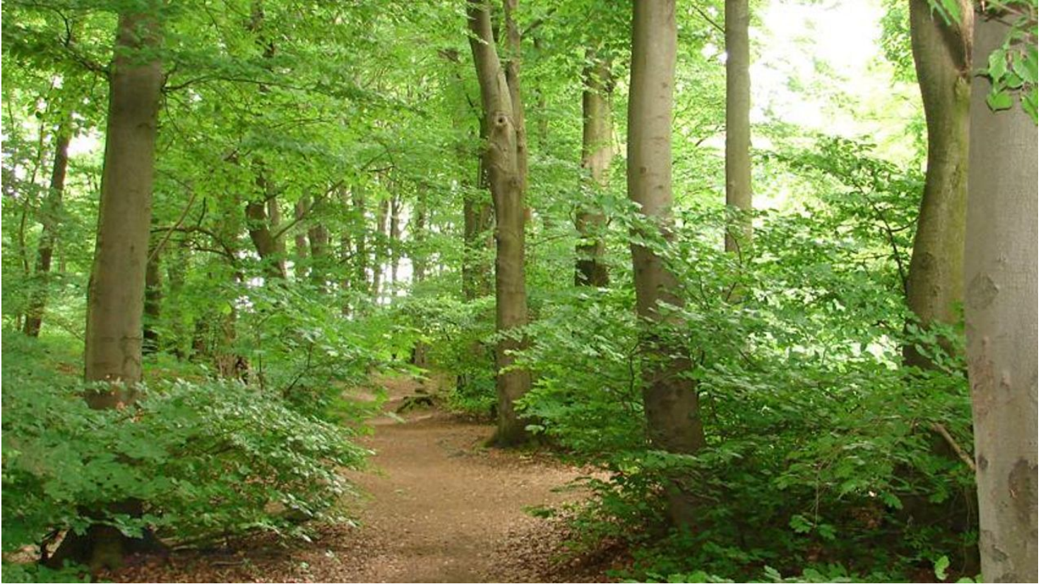
Naturnahe Wegeführung der Variante via Bethelauen