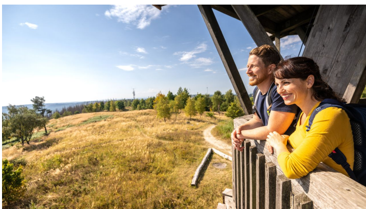
Preußischer Velmerstot-Kreis Lippe-Teutoburger-Wald-Tourismus-D-Ketz-048.jpg