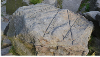
Historischer Stein mit Richtungsweisung an der Lippischen Velmerstöt