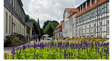
Bad Driburg - Gräflicher Park - Hauptachse - © Bad Driburger Touristik GmbH, Frank Grawe