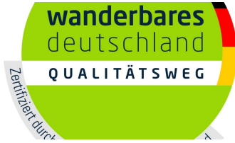
Logo Qualitätsweg Wanderbares Deutschland