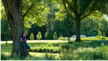
Gräflicher Park