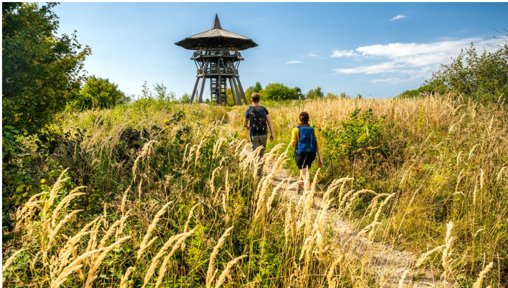
Preußischer Velmerstot-Kreis Lippe-Teutoburger-Wald-Tourismus-D-Ketz-044.jpg