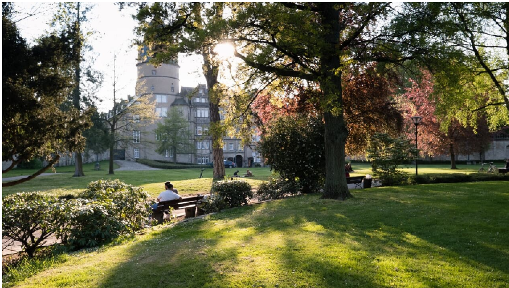
Schlosspark Detmold