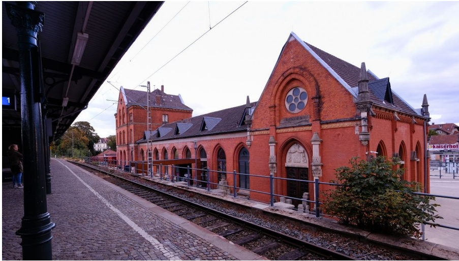
Bahnhof Detmold