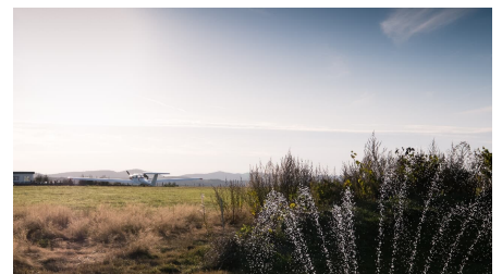
Flugplatz Detmold