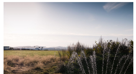
Flugplatz Detmold