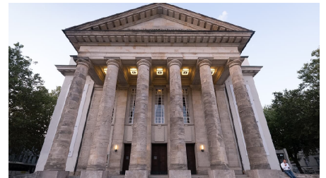
Landestheater Detmold