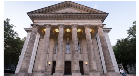
Landestheater Detmold