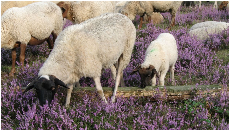
Schafe und Heide - © Teutoburger Wald/Stadt Bielefeld - Umweltamt/Dietmar Althaus