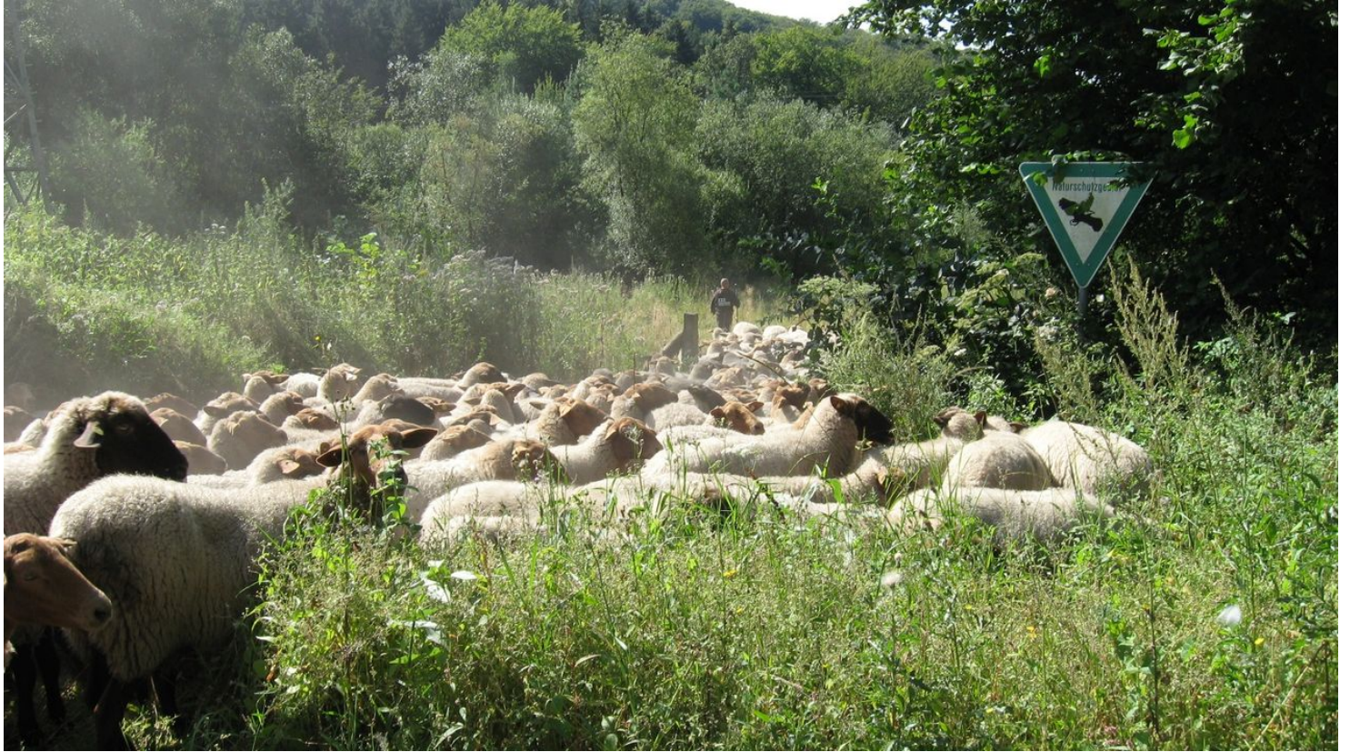
Schafe im Markengrund