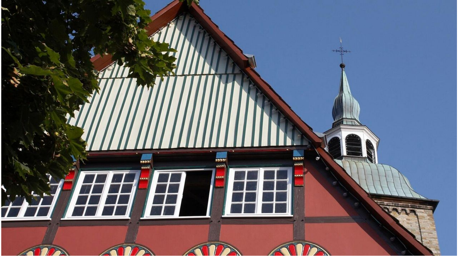
Historisches Fachwerkhaus in Wiedenbrück