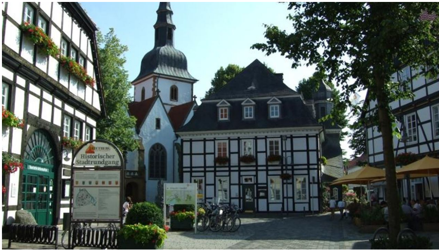
Bolzenmarkt im Historischen Stadtkern