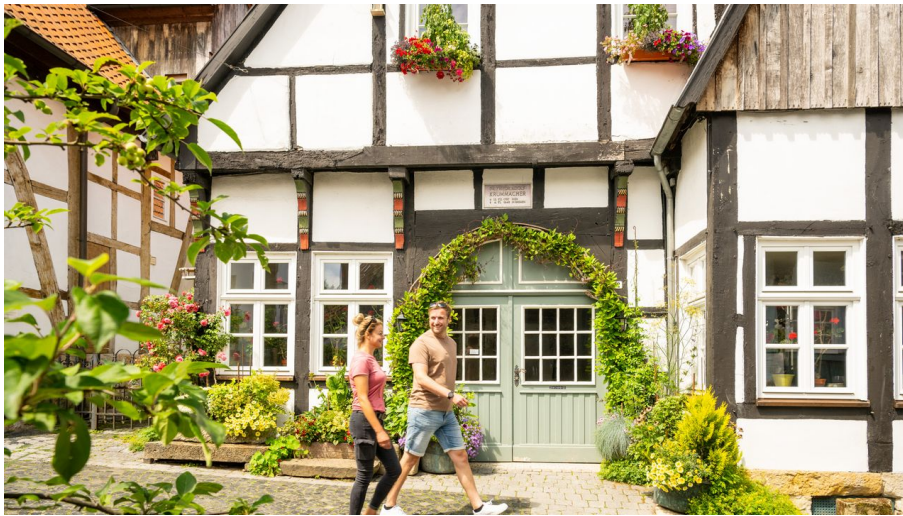
Tecklenburg-Altstadt-Tecklenburger Land, D. Ketz-2023-120.jpg