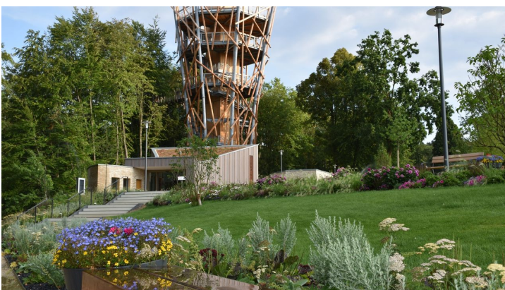
Baumwipfelpfad Bad Iburg