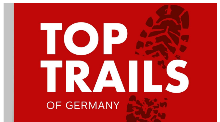
Logo der Top Trails of Germany