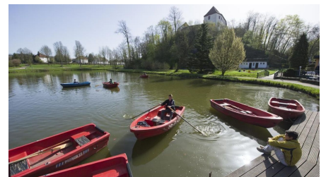
Charlottensee am Bad Iburger Schloss