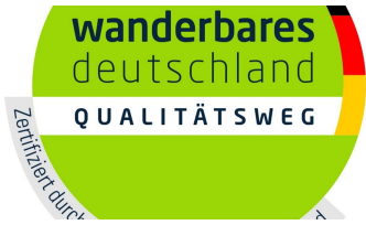
Logo Qualitätsweg Wanderbares Deutschland