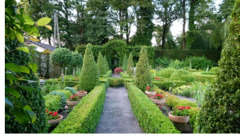
Heckentheater in Lienen