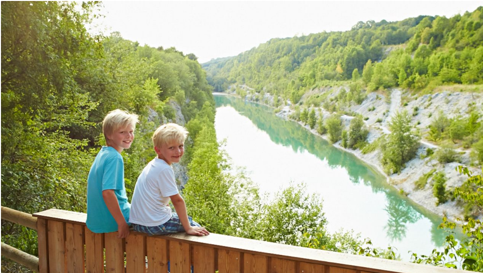
Lengerich_Canyon-3_Foto Stadt Lengerich.jpg