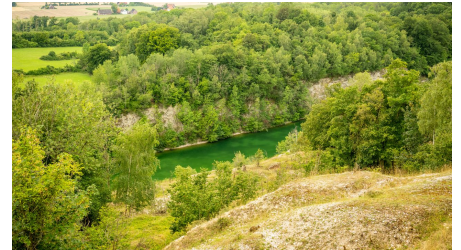
Lengerich-Canyon Tour-Tecklenburger Land, D. Ketz-2023-167.jpg