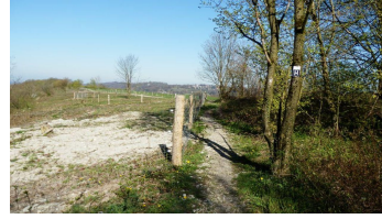
Aussicht vom Kleeberg zur Hochfläche