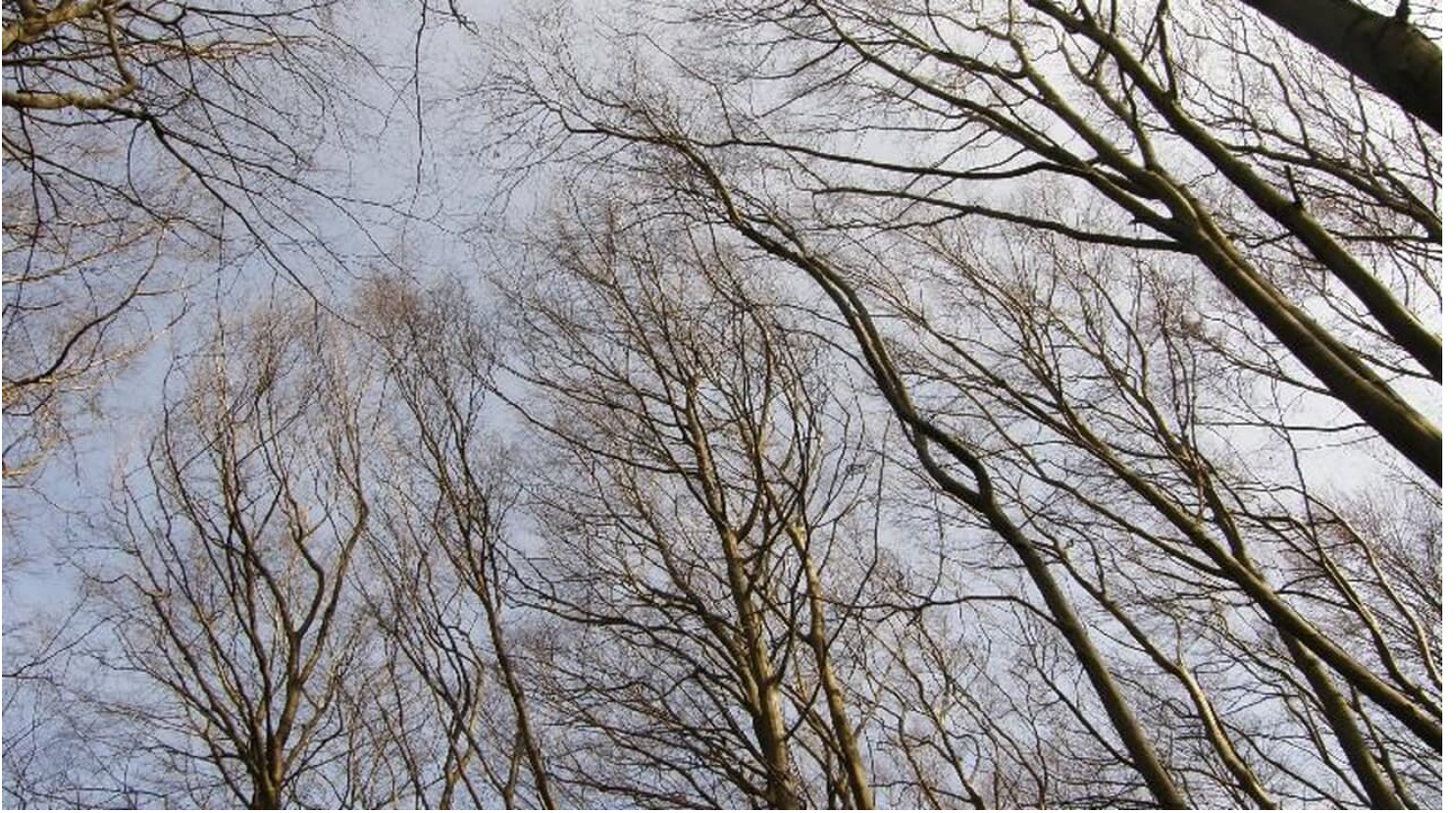
Buchenkronen im Herbst