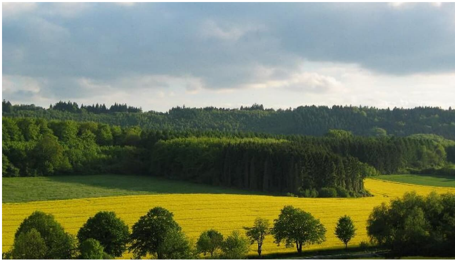
Währentrup Rapsblüte