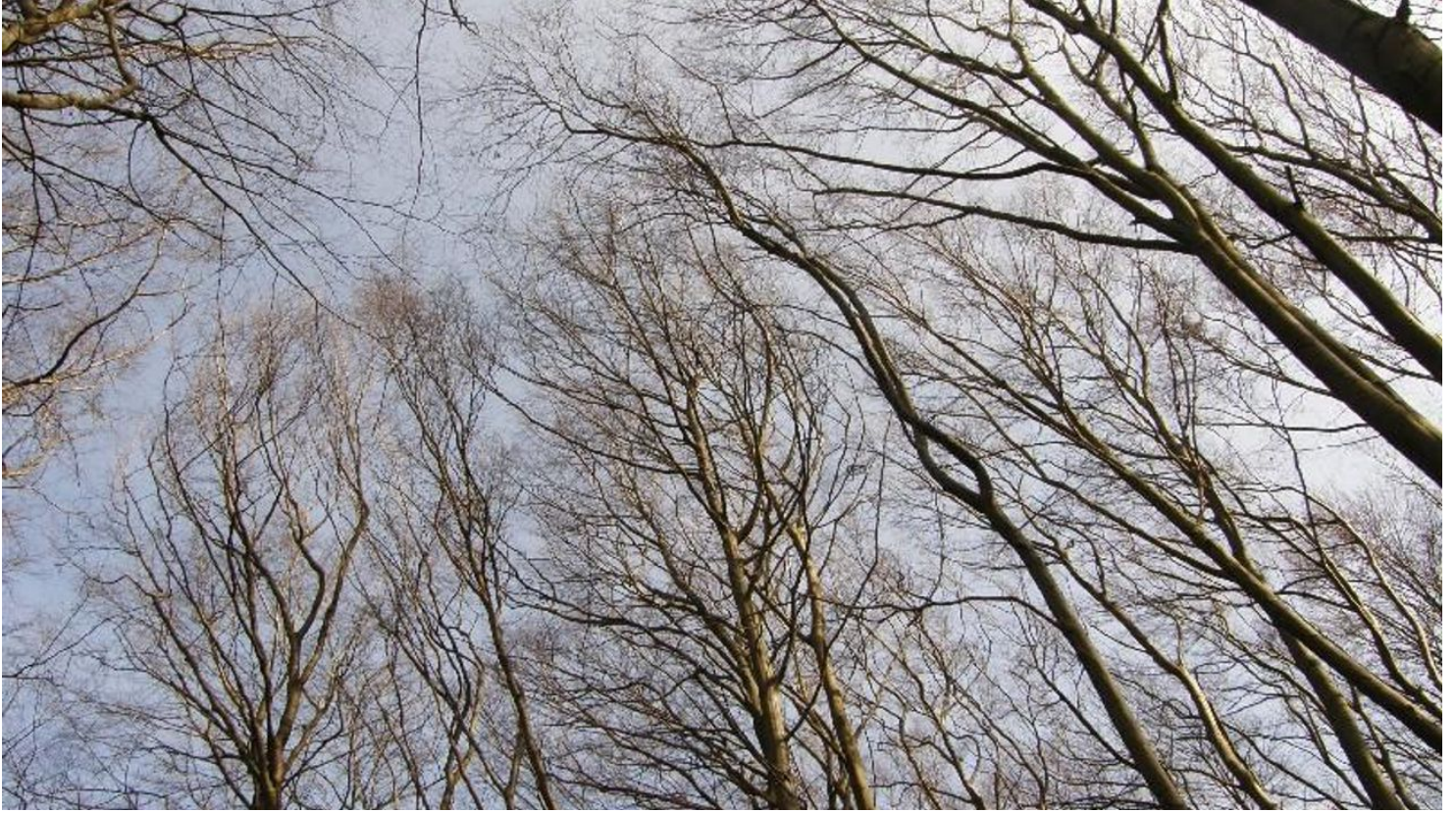
Buchenkronen im Herbst