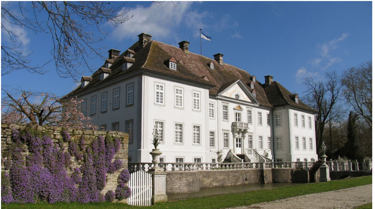
Wasserschloß Vinsebeck