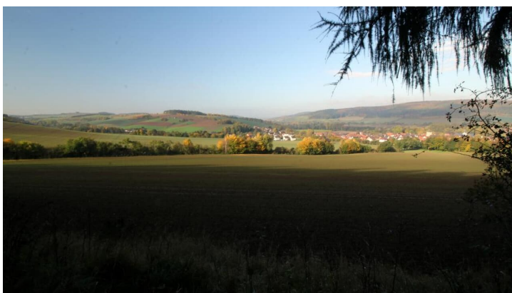
Blick vom Osterberg ins Nethetal