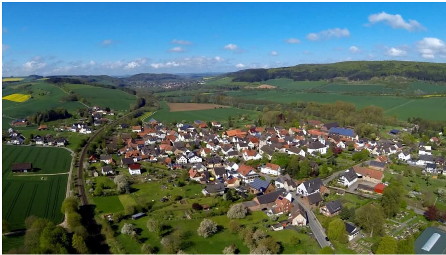
Blick auf Amelunxen