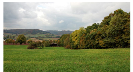
Blick ins Nethetal vor Amelunxen