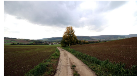
Immental vor Amelunxen - © Markus Niemann, Tourist-Information Beverungen