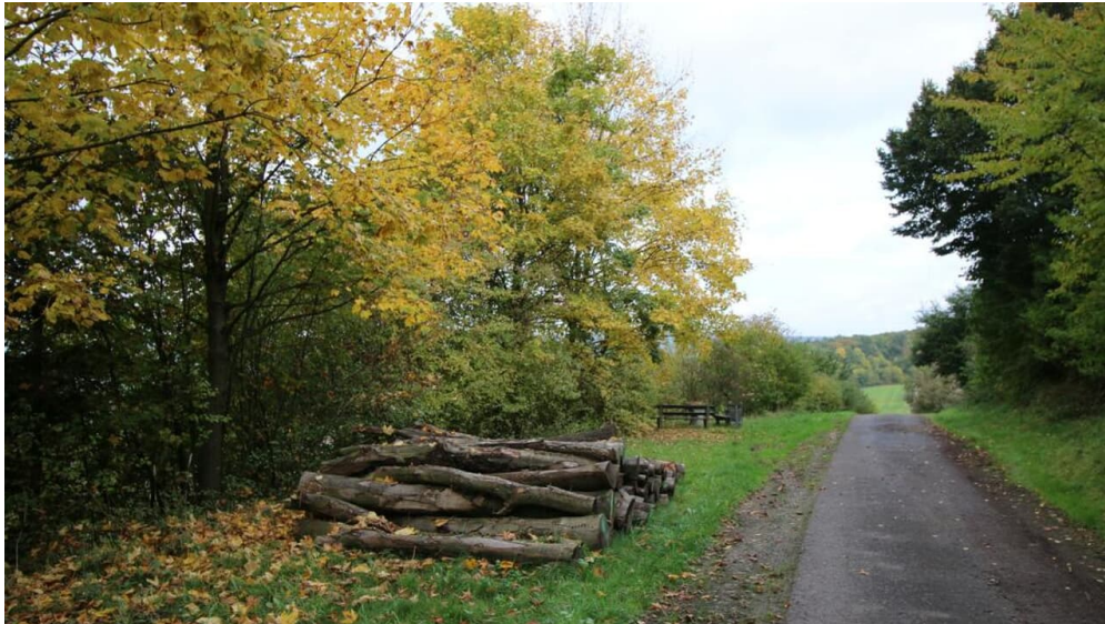
Rastplatz und Aussichtspunkt am Osterberg