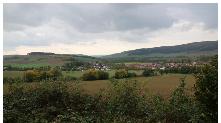
Blick vom Osterberg ins Nethetal