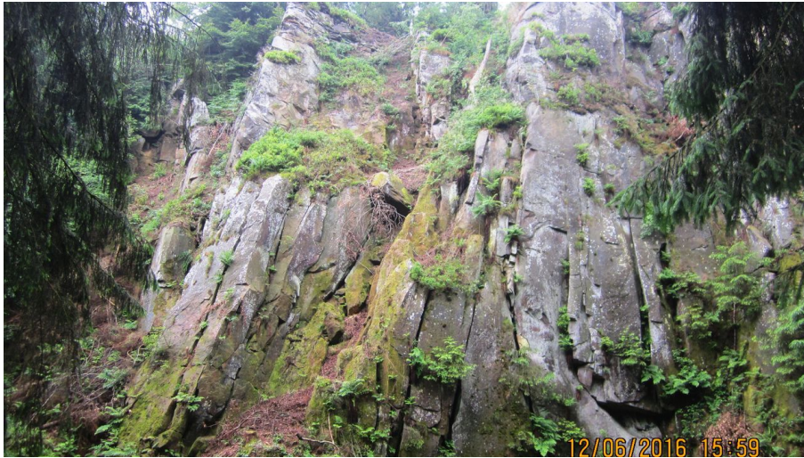
Kalksteinklippen unterhalb der Preußischen Velmerstot