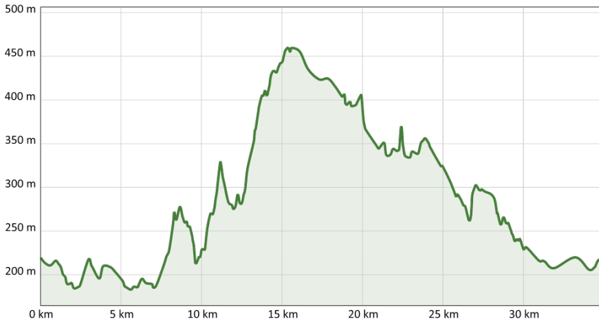
Aussicht vom Eggeturm nach dem Durchzug eines Regengebietes, Naturdenkmal in nördlicher Richtung

Externsteine, Natur- und Kulturdenkmal mit Informationscenter.