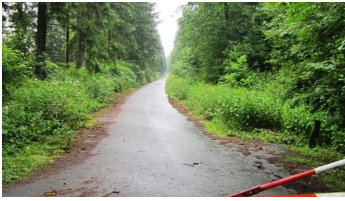
letzte Reste der militärischen Nutzung des Gipfelplateaus