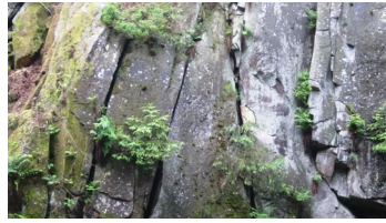
Kalksteinklippen unterhalb der Preußischen Velmerstot