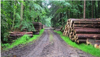
Wirtschaftswald im Silberort