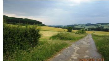
Wirtschaftswege zwischen Bellenberg und Ziegenberg