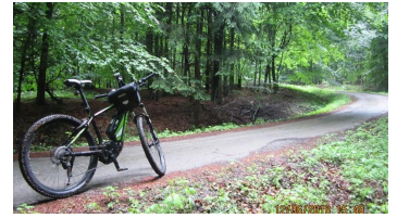
Steiler Forstweg am Eggeosthang