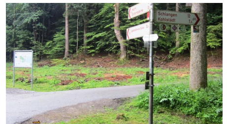
Kreuzungspunkt touristischer Rad- und Wanderwege an den Externsteinen