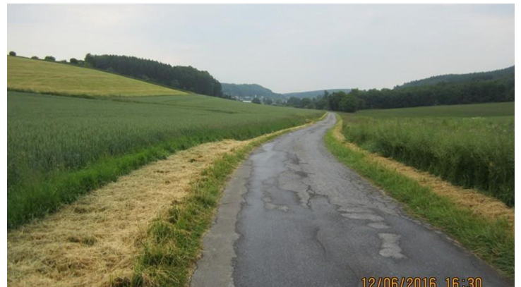
Veldrom im oberen Silberbachtal