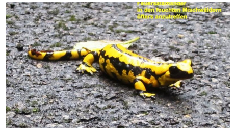
Feuersalamander nach einem Regenschauer