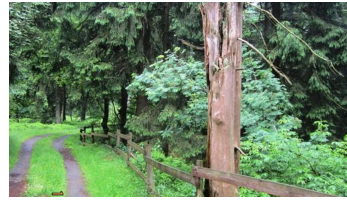
NSG Velmerstot Klippen - © Manfred Wiehenkamp, HAVERGOH Hotel H-BM