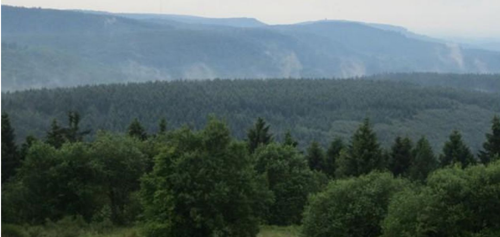
Aussicht vom Eggeturm