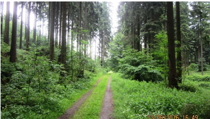
Naturweg im Zangenbachtal