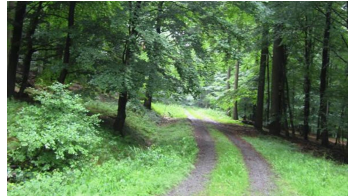
Buchenhochwald am Ziegenberg