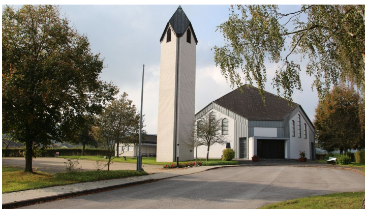
Johannes Nepomuk Kirche