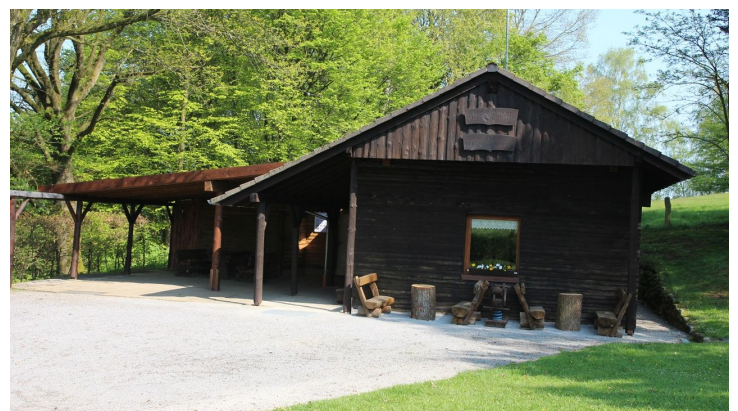
EGV Hütte Langeland