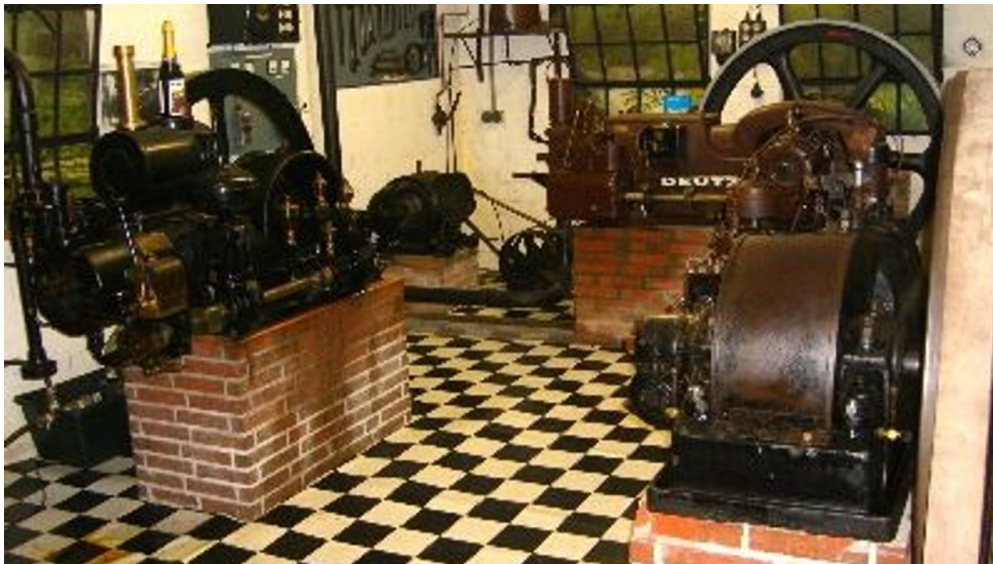
Motorenmuseum der Familie Pott