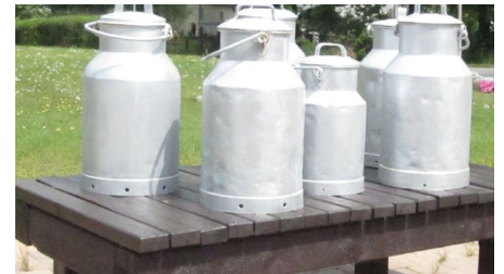
Historische Milchkannen