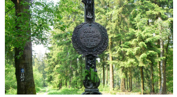
Schwarzes Kreuz