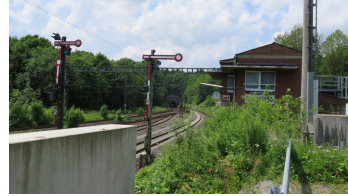
Betriebsbahnhof Langeland