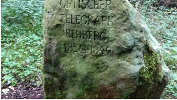
Optischer Telegraph Stein