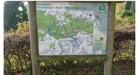
Naturpark Nördlicher Teutoburger Wald - Wiehengebirge