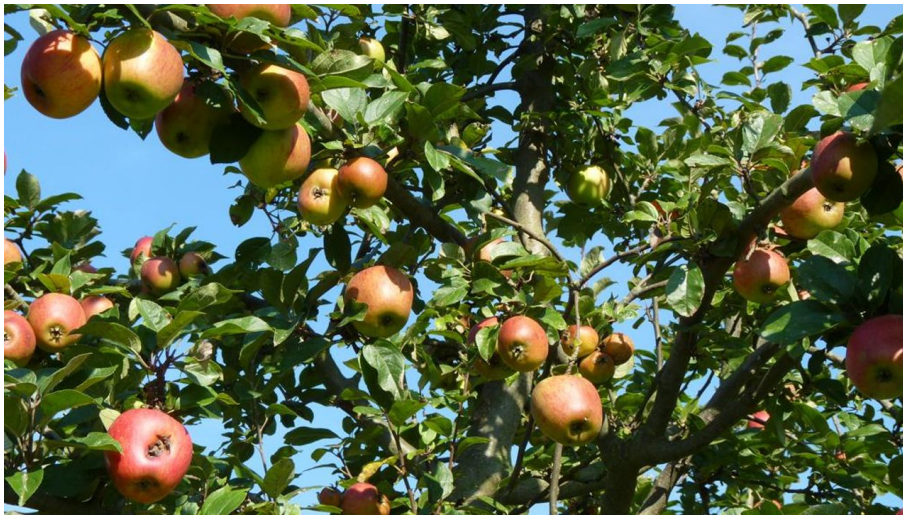
Apfelbaum auf der Streuobstwiese