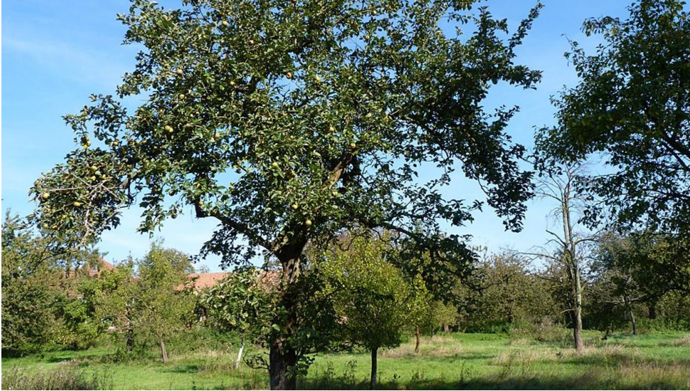
Größte Streuobstwiese im Kreis Herford