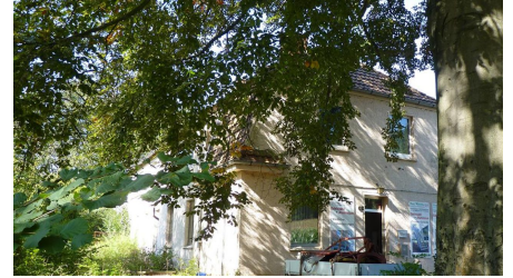
Ehemalige Abdeckerei