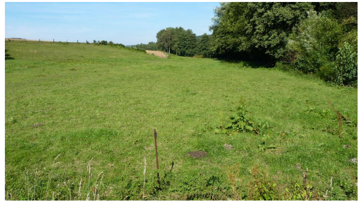
NSG Auebachtal