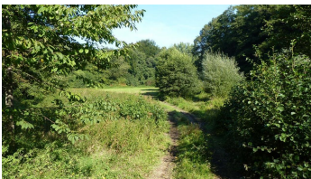
NSG Habighorster Wiesen - © Biologische Station Ravensberg im Kreis Herford e.V.