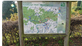
Naturpark Nördlicher Teutoburger Wald - Wiehengebirge