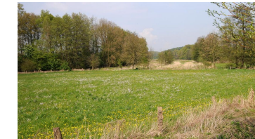
NSG Kilverbachtal