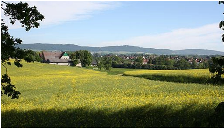
Blick auf Klosterbauerschaft und das Wiehengebirge