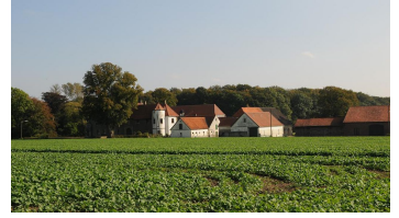
Haus Kilver