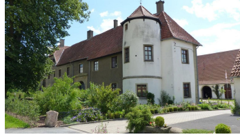
Haus Kilver - Turm