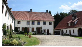
Haus Kilver - Innenhof - © Biologische Station Ravensberg im Kreis Herford e.V., Unbekannt