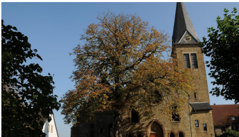
Michaelkirche - © Biologische Station Ravensberg im Kreis Herford e.V.