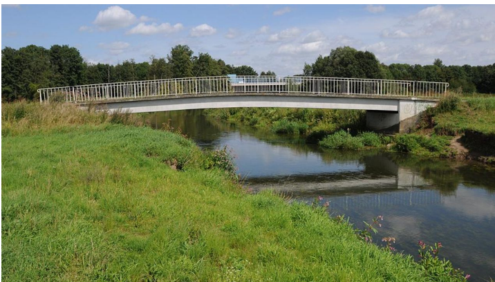
Alte Else - neue Else - © Biologische Station Ravensberg im Kreis Herford e.V.