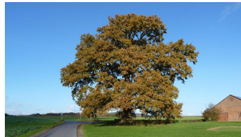
Naturdenkmal Eiche