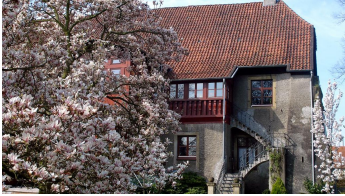
Haus Kilver