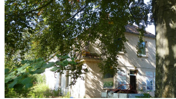
Ehemalige Abdeckerei