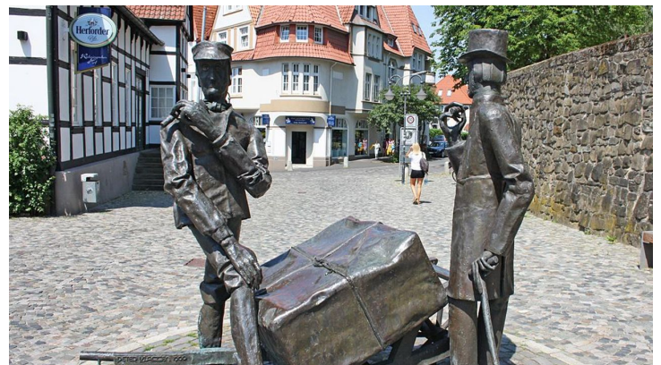
Steinmeister- und Wellensiek-Denkmal