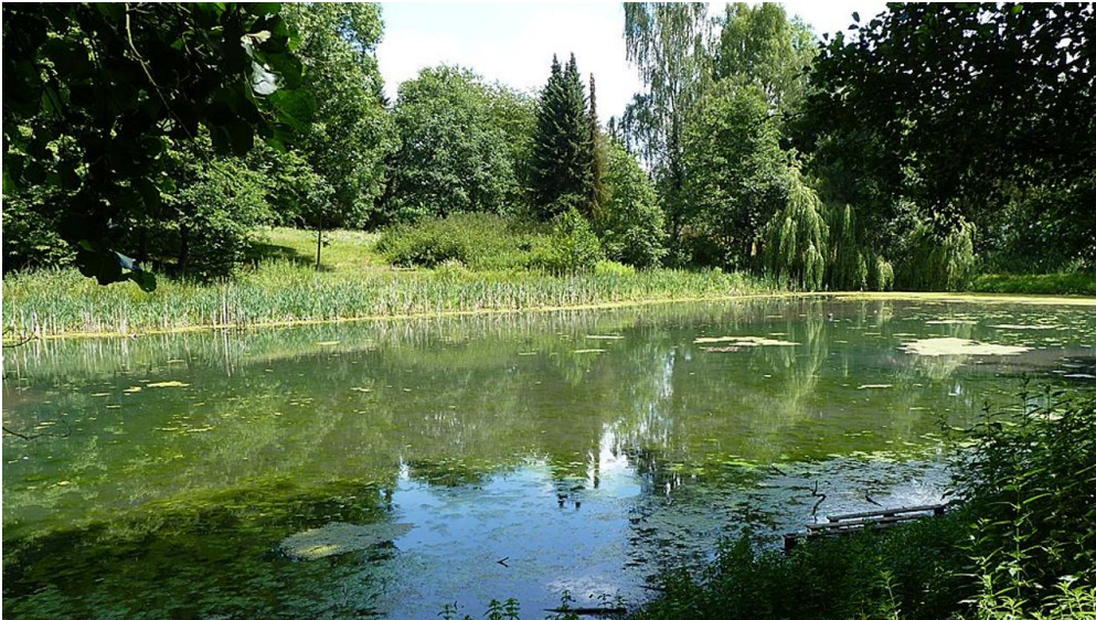
Kurpark Randringhausen