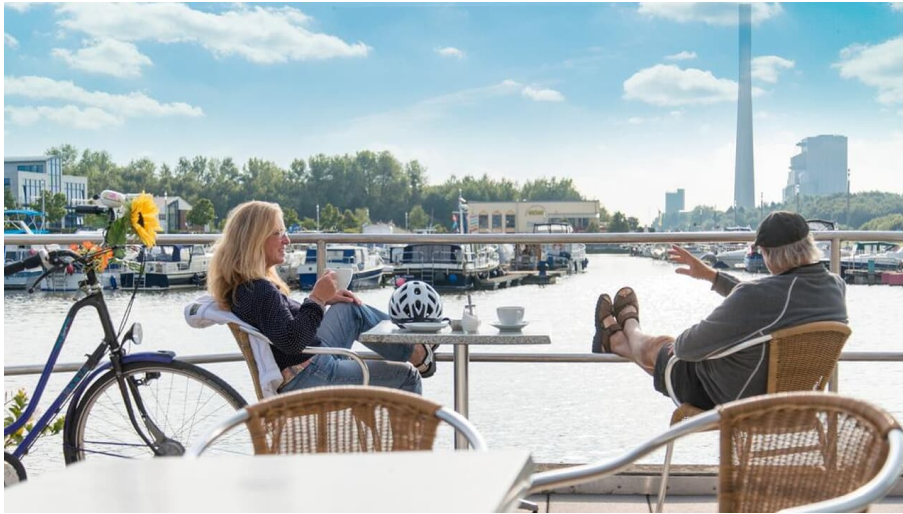
Stadt Bergkamen, Stadt Bergkamen