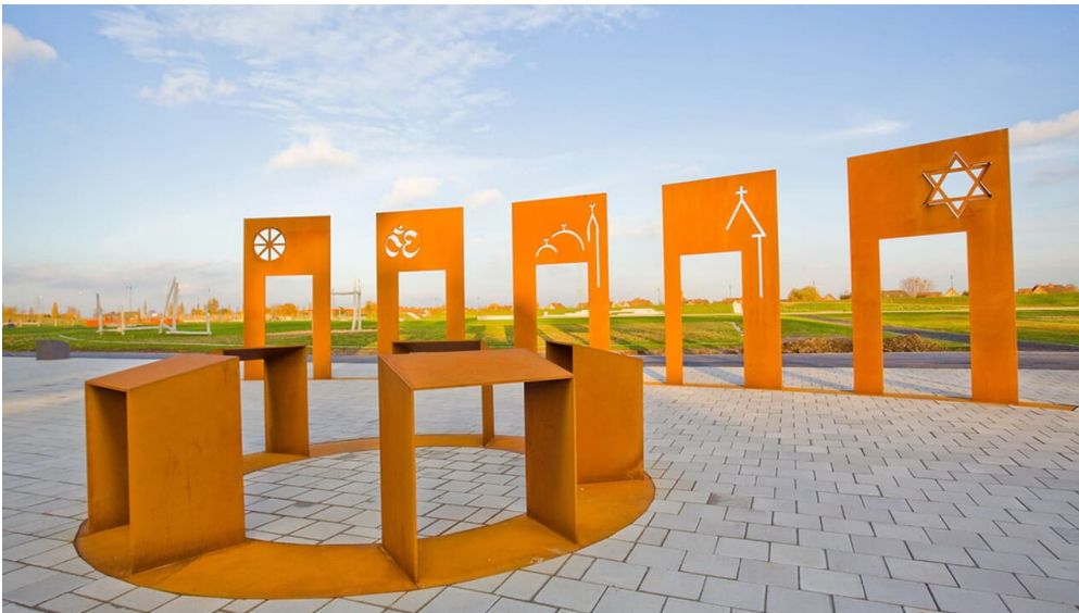
Lippepark Hamm