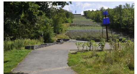
Bergehalde Großes Holz