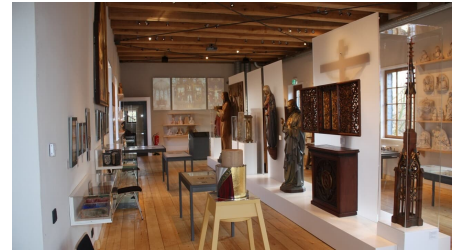
Museum Wiedenbrücker Schule - © Stadt Rheda-Wiedenbrück