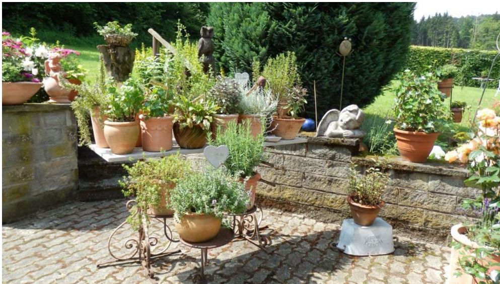
Kräutergarten am Landgasthof Mücke in Marsberg