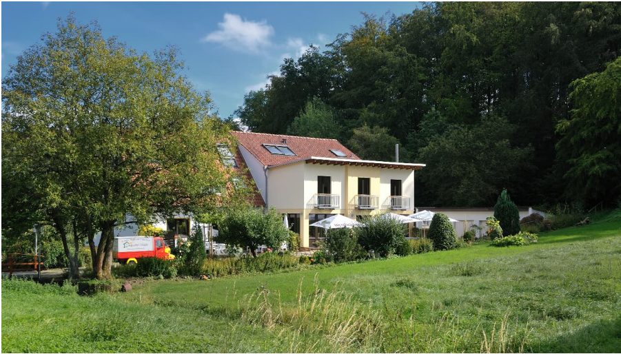
Landgasthof Mücke Marsberg _ 3.jpg