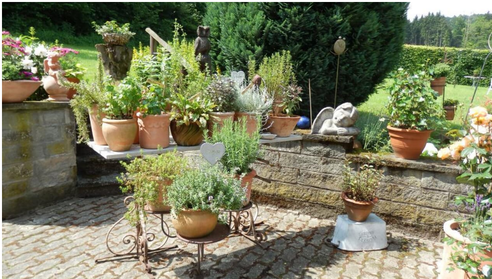
Kräutergarten am Landgasthof Mücke in Marsberg