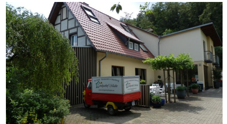
Außenansicht, Landgasthof Mücke in Marsberg