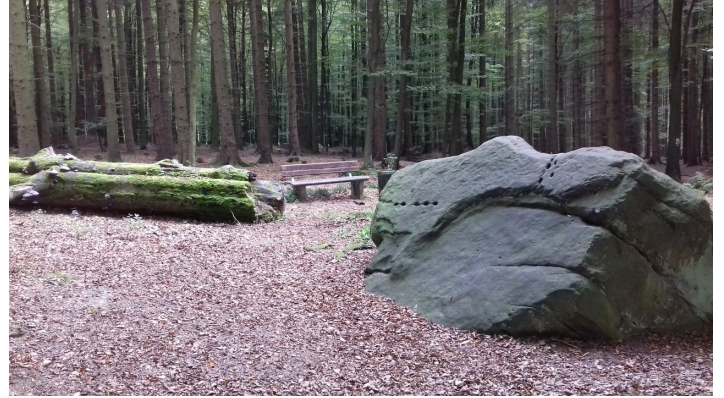
Leistruper Wald Route