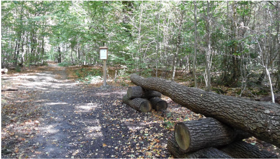
Leistruper Wald Route