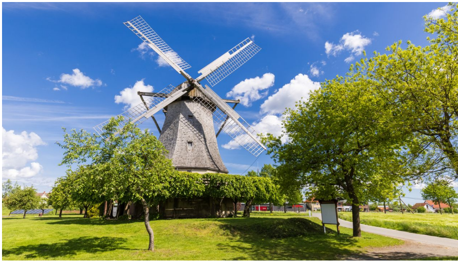
Windmühle Destel