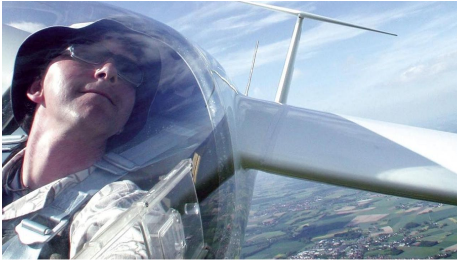
Segelflieger über Oerlinghausen