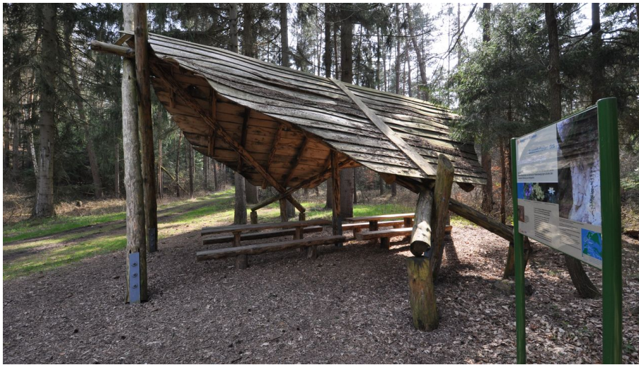
Schutzhütte - Unterstand