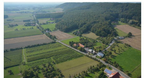
Luftbild Stemweder Berg