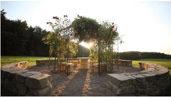
Wilhelmshöhe Umgebung