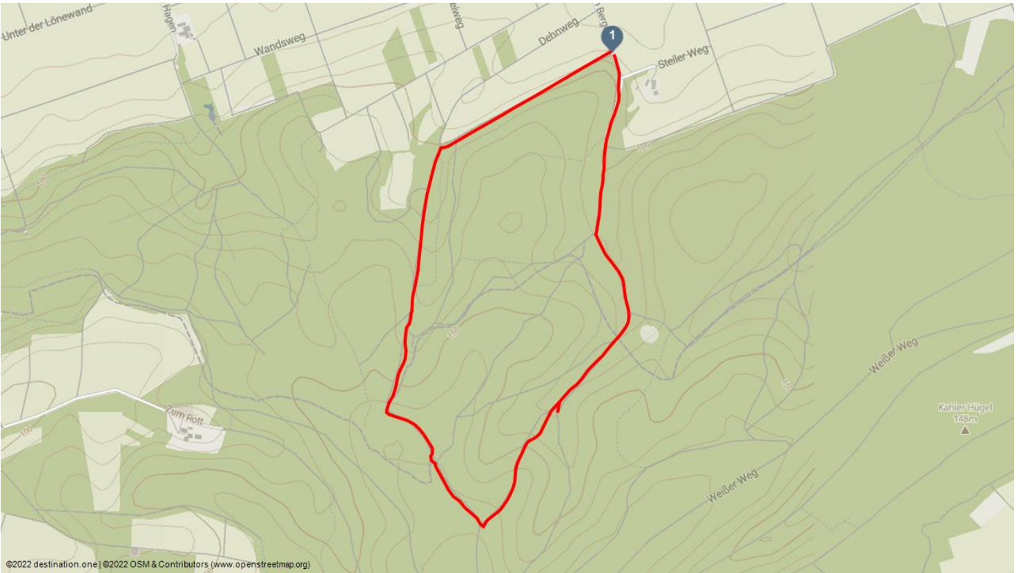
©2022 destination.one | ©2022 OSM & Contributors (www.openstreetmap.org)