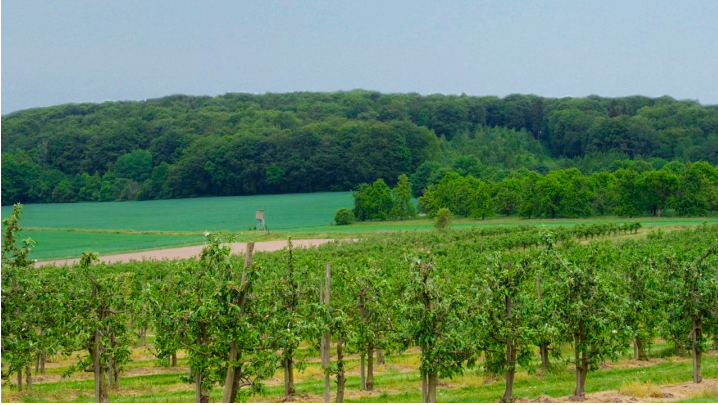
Stemweder Berg - © Sabine Denker, Gemeinde Stemwede, unknown