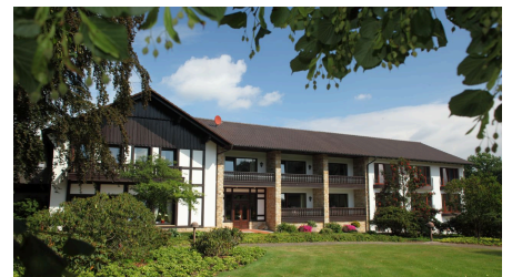
Berggasthof Wilhelmshöhe