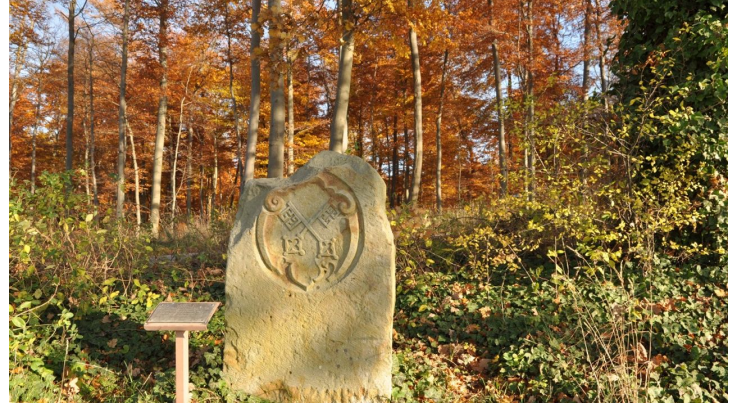
Grenzstein Hannover - Preußen am Stemweder Berg - © Gemeinde Stemwede