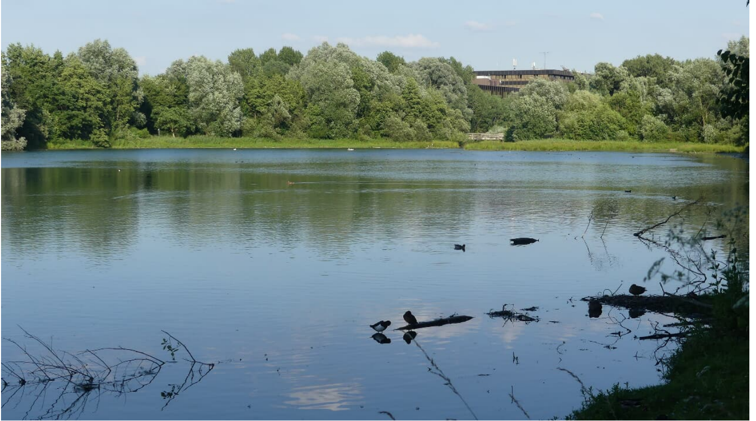
Padersee mit HeinzNixdorf MuseumsForum