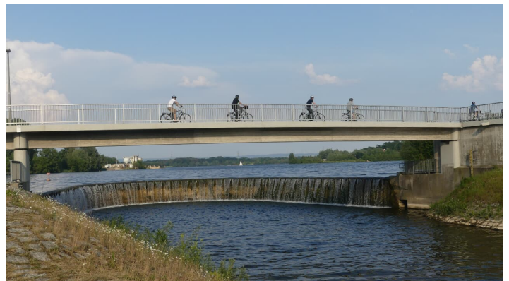
Auslaufbauwerk und Fußgänger-/Radfahrerbrücke