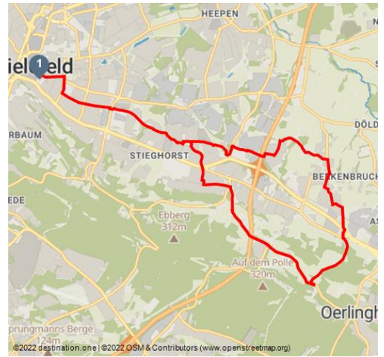
Knotenpunktserie Radtouren-Tipp 6