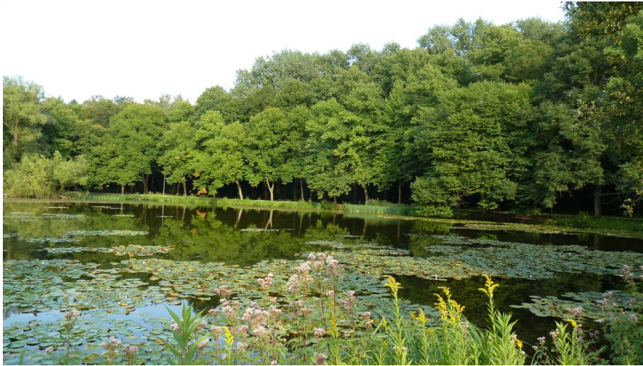
Naherholungsgebiet Fischteiche