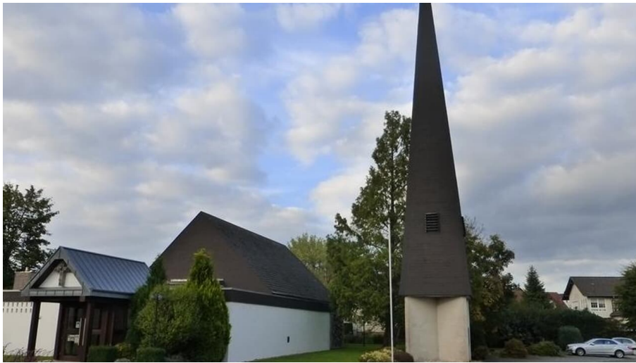
Evangelische Kirche Paderborn-Elsen