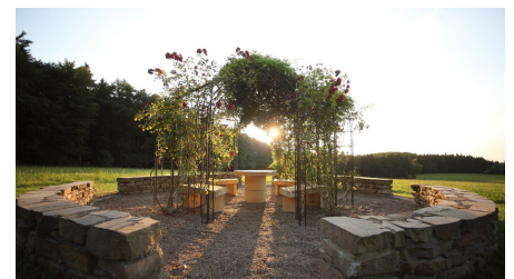
Wilhelmshöhe Umgebung