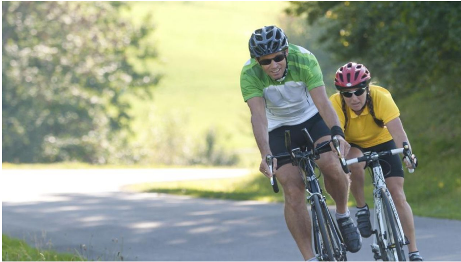
Rasante Abfahrt