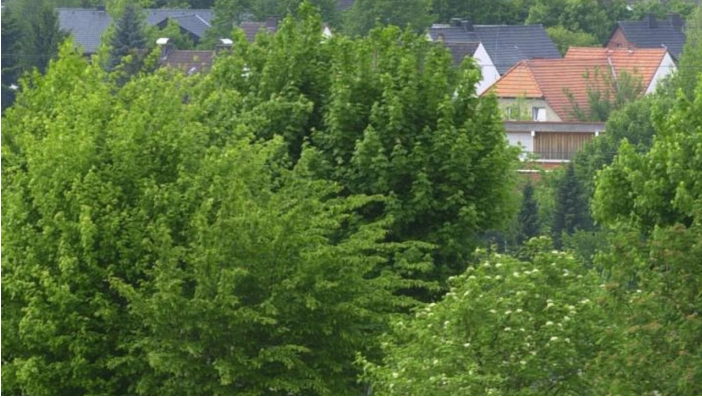
Radfahrer vor Abtei Marienmünster