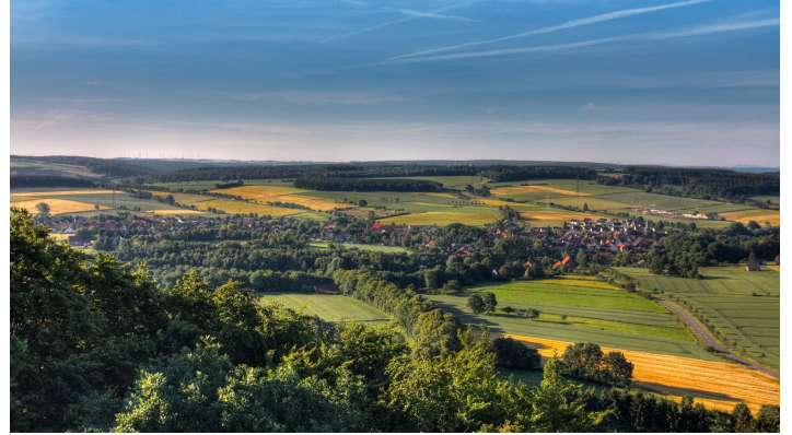
Blick auf Höhendörfer