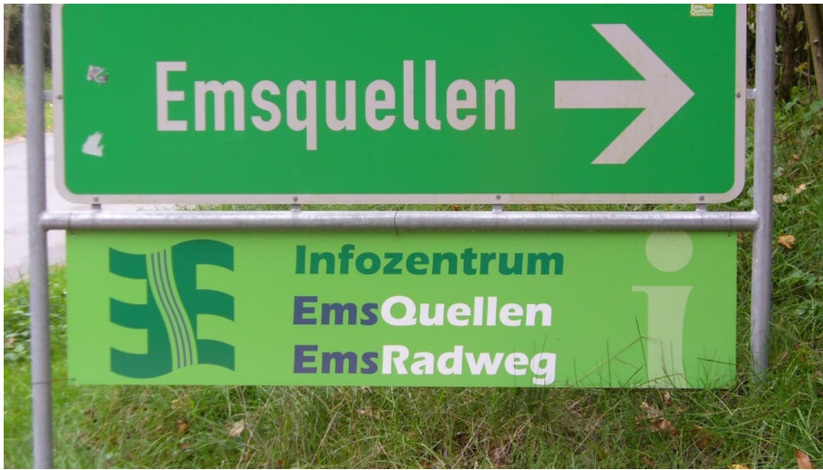
Hinweisschild am Emser Kirchweg