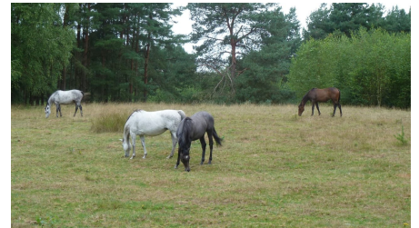
Senner Pferde in der Moosheide