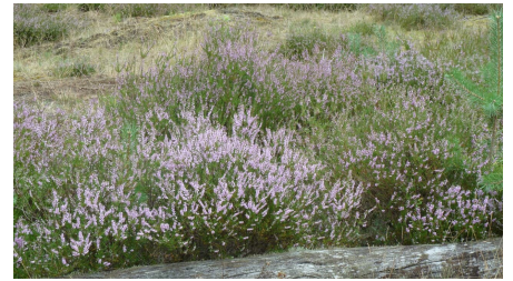
Heideblüte in der Moosheide