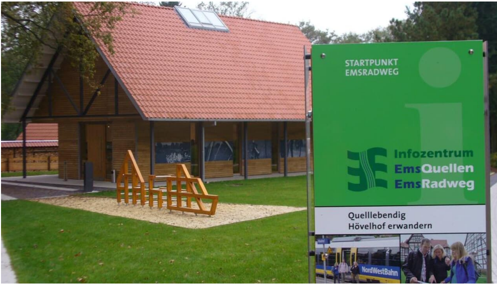
Infozentrum Emsquellen und Emsradweg - © Karl Heinz Schäfer, Tourist Information Paderborn