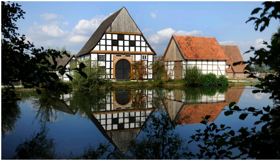
Der Dorfeich des LWL-Freilichtmuseums Detmold.