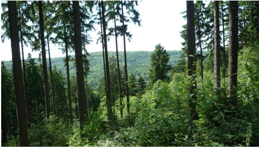
Schöne Ausblicke entlang des Weges