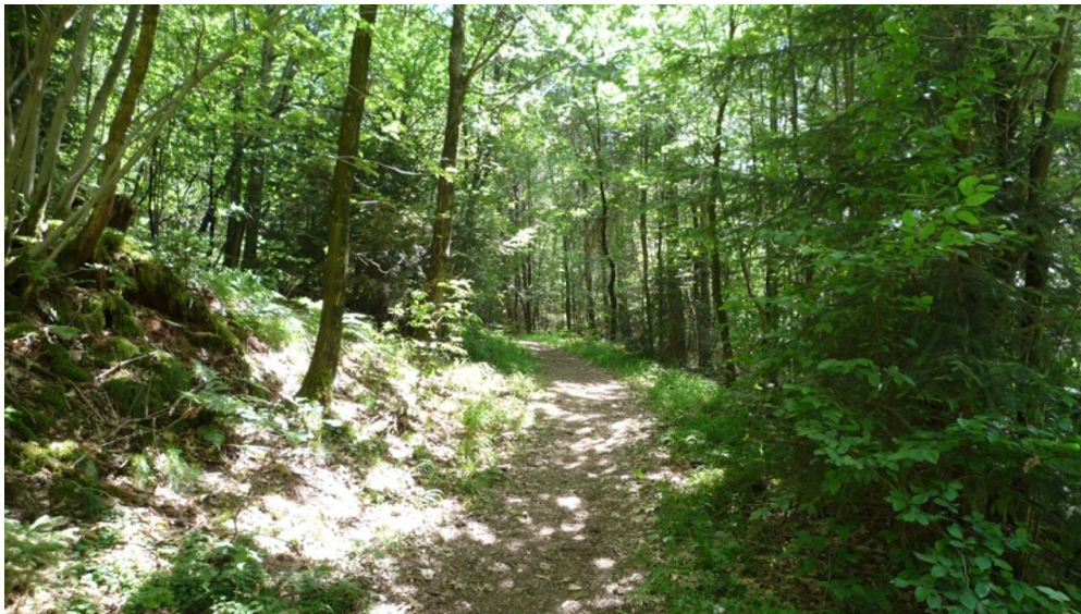
Pfad durch den Wald