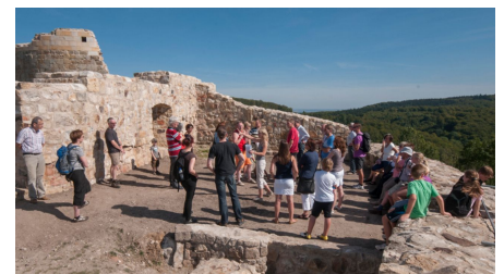
Wunderschöner Ausblick von der Falkenburg