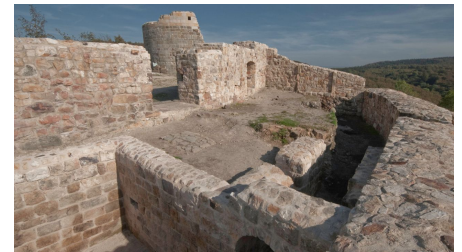
Die historisch geprägte Falkenburg bei Berlebeck