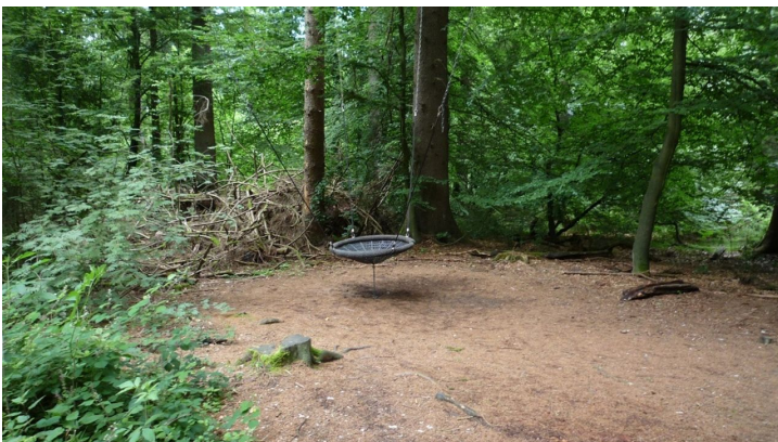
Attraktionen für Kinder