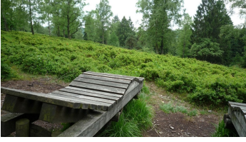
Landschaftslogen bieten eine schöne Aussicht - © Naturpark Teutoburger Wald/Eggegebirge