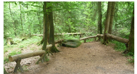
Spielmöglichkeiten für Kinder