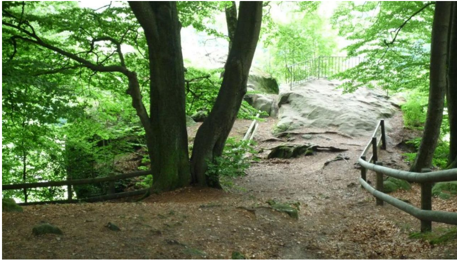
Schöne Aussichten am OH6