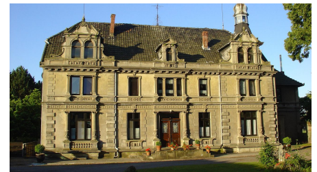
Schloss Südhemern im Mühlenkreis