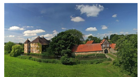
Gut Stockhausen im Mühlenkreis