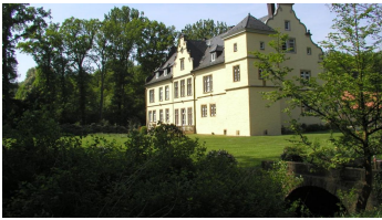
Schloss Crollage im Mühlenkreis