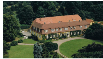
Gut Oberfelde im Mühlenkreis