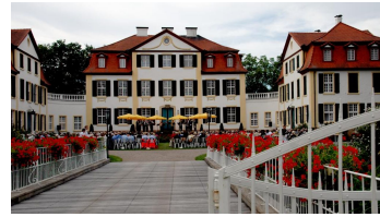
Schloss Hüffe im Mühlenkreis