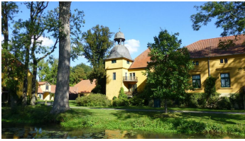
Gut Böckel