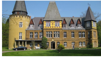
Schloss Hollwinkel im Mühlenkreis