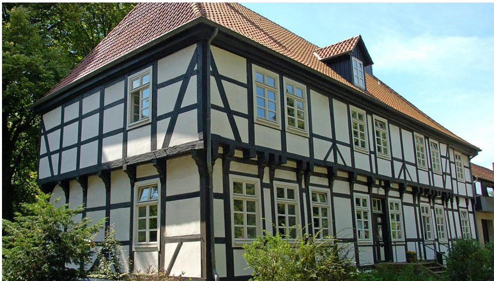
Herrenhaus in Stift Quernheim - © Biologische Station Ravensberg im Kreis Herford e.V.