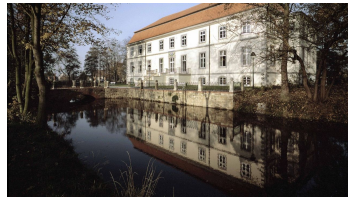
Schloss Ovelgönne