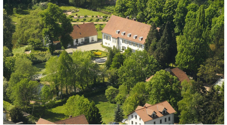
Kurpark Preussisch Oldendorf