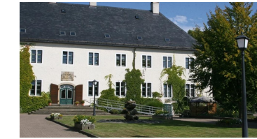
Schloss Benkhausen im Mühlenkreis