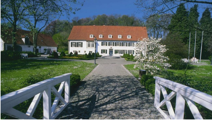
Haus des Gastes mit Kurpark