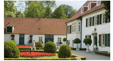
Gut Hudenbeck im Mühlenkreis - © LWL - Horst Gerbaulet, Mühlenkreis Minden-Lübbecke