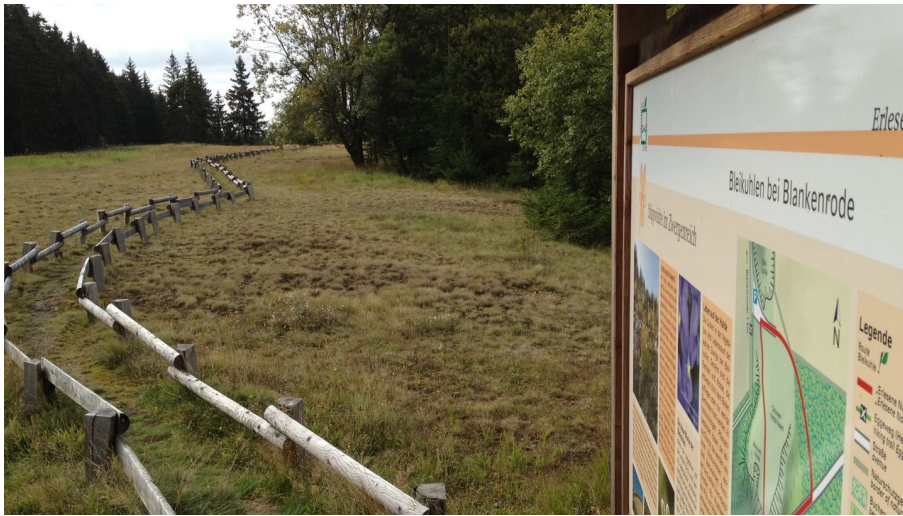
Bleikühlen | Lichtenau-Blankenrode