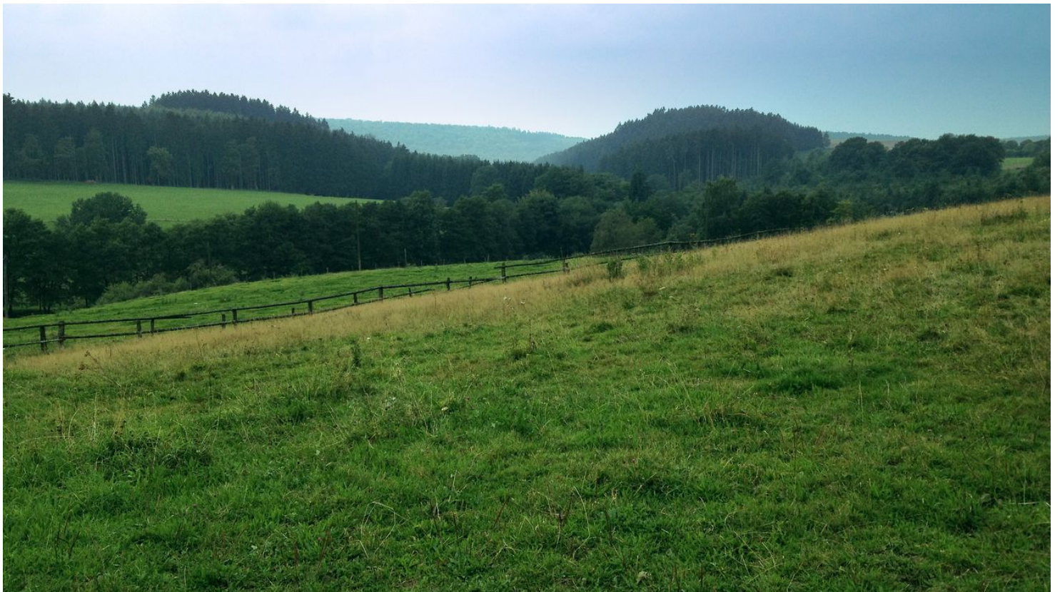
Rundwanderung Marschallshagen | Lichtenau