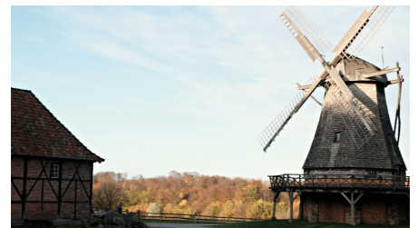
Einblicke in das LWL-Freilichtmuseum