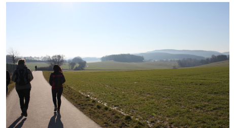
Von Fachwerk zu Fachwerk