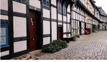
Historische Altstadt Detmold - © Teutoburger Wald / Stadt Detmold / B. Fromberger