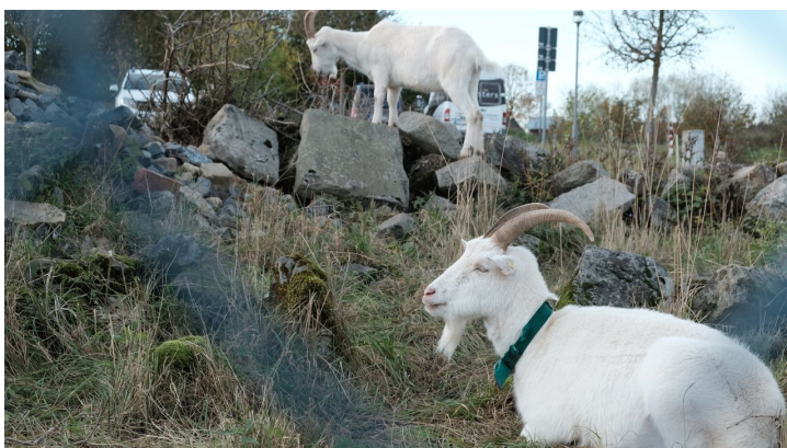
Einblicke in das LWL-Freilichtmuseum