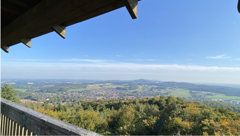
Borgholzhausen - Ausblick vom Luisenturm