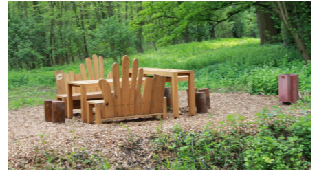
Rastplatz "Fühlen"