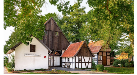
Versmold - Heimatmuseum